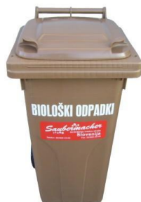
Slika 6: Namenska embalaža za zbiranje biorazgradljivih odpadkov