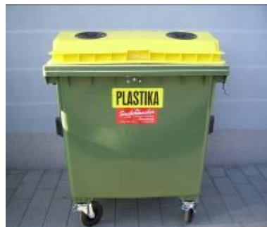
Slika 5: Namenska embalaža za zbiranje plastične, kovinske, sestavljen in mešane embalaže