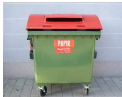
Slika 4: Namenska embalaža za zbiranje papirja in papirne embalaže