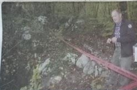
Brane Čuk pri vhodu v brezno