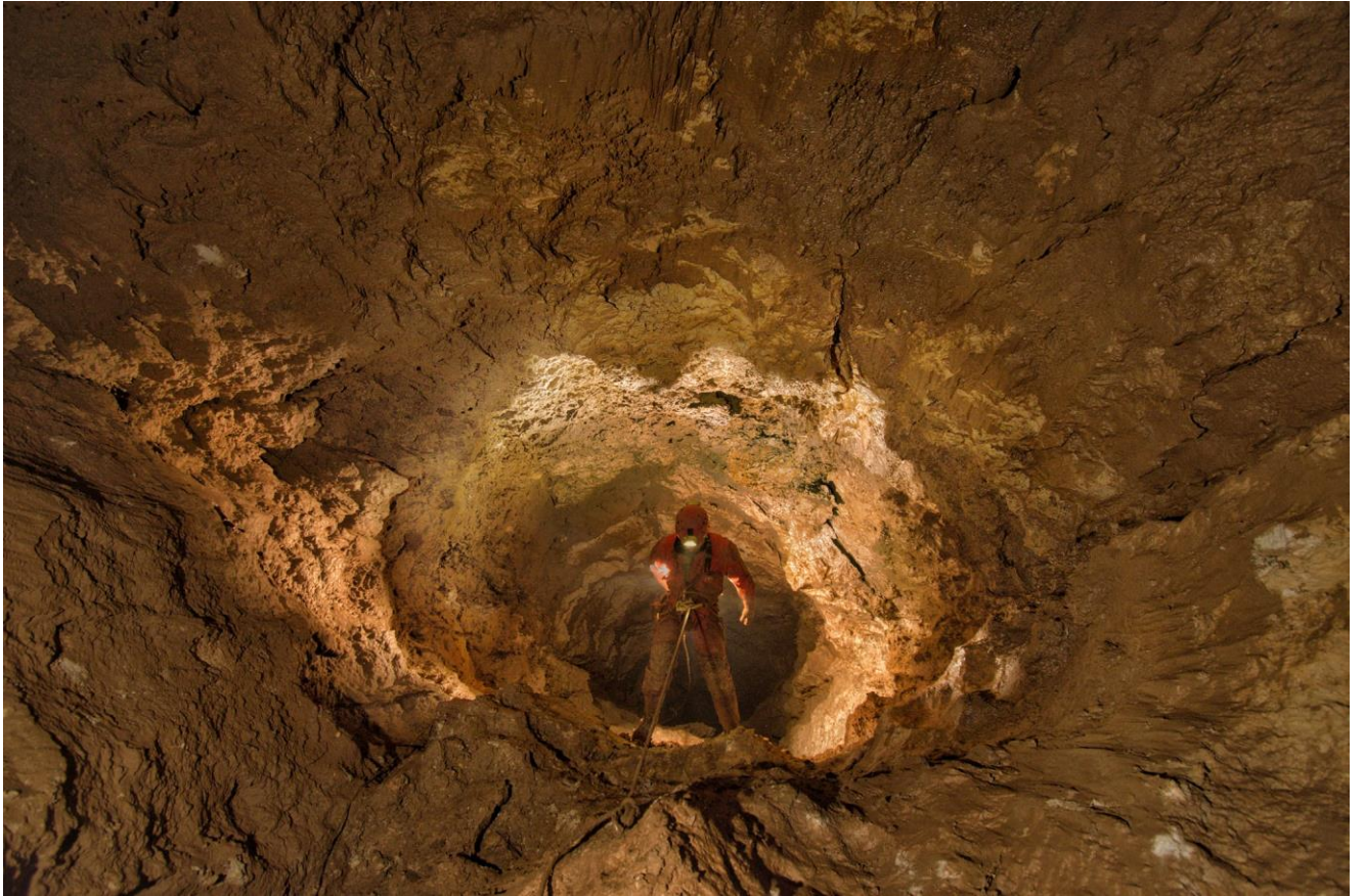
brezno Gorjanc – 60 m