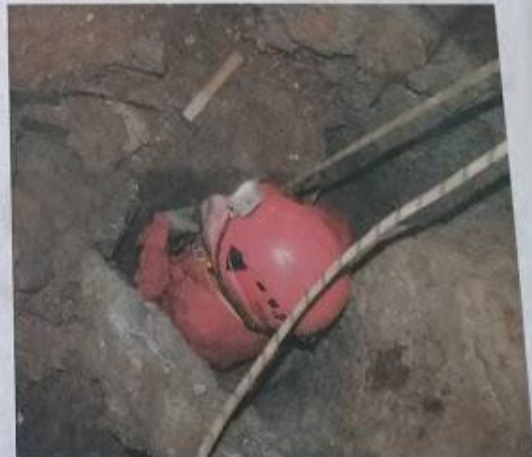
Vhod v brezno