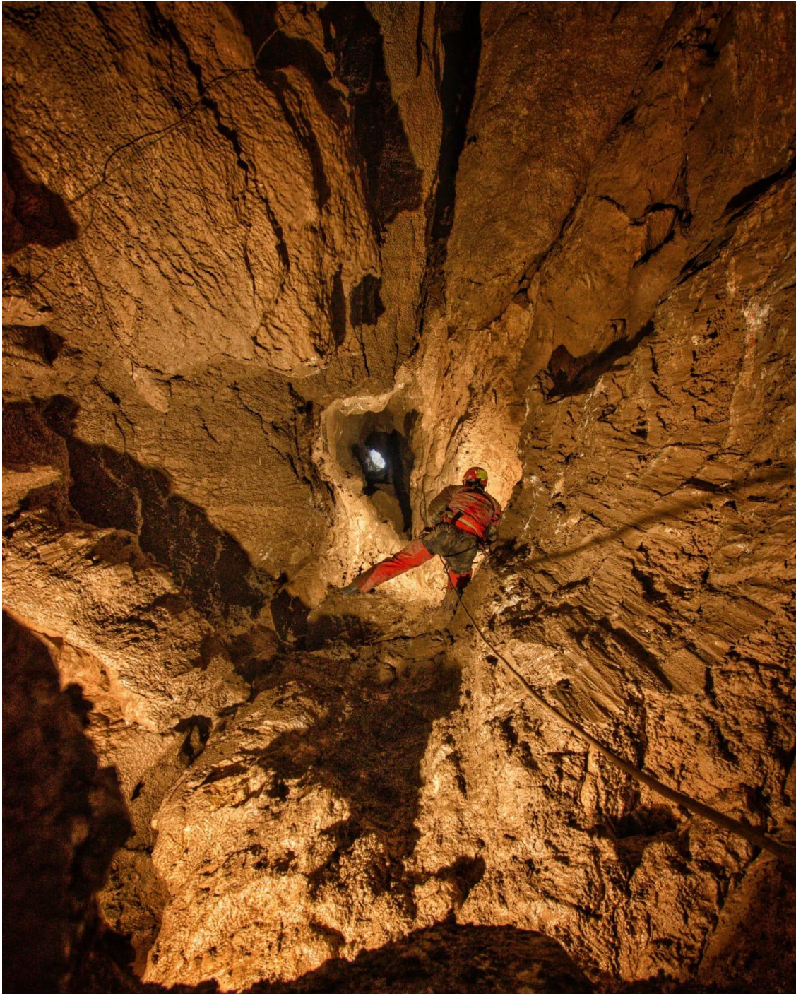
Gorjanc – pogled ven