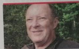
Brane Čuk Klub jamarjev Kostanjevica na Krki

Lani so v klubske vrste pridobili nekaj mladih jamarjev, letos so v osnovni šoli načrtno razpisali krožek za tretjo triado, tako si čez nekaj let