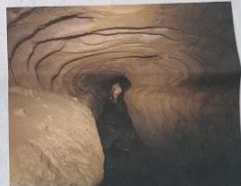
Kot neskončno