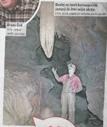
Drevo je izredno kostanjeviki jamarji še štiri večje akcije.