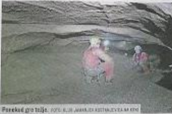
Presek gro tajne.

že vprašala v elitni klub 100, torej med 100 najdaljših jam v Sloveniji, kar je dosežek, ki so mu nazivali s kampar-cem. V Sloveniji je okoli 13.500 raziskanih jam, že zdaj pa je Himalalaja med največjimi doljenjskimi kraškimi jamami. In resnično jo lepa, pravijo jamarji, ki so se podali vanjo, v njej je precej kapniških tvorb. Največji kapnik, ki so ga zdaj videli v njej, je visok sedem metrov, a ga zaradi težkega dostopa še niso ujeli v objektiv fotoaparata, sicer pa njihov fotograf Žan Stokar najlepše posnetke hrani za nastajajoči klubski kalendar, ki bo posvečen Himalaji, odpravi v Grčijo in 50-letnici kluba.