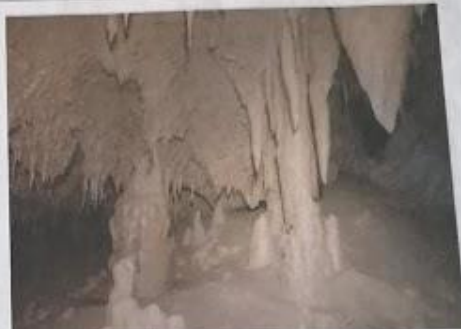
Himalaja skriva kapnike in druge okrasje.