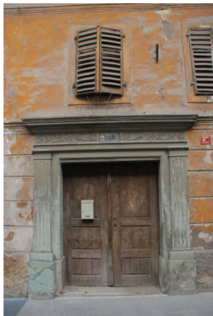
Tržic - Hiša Trg svobode 29