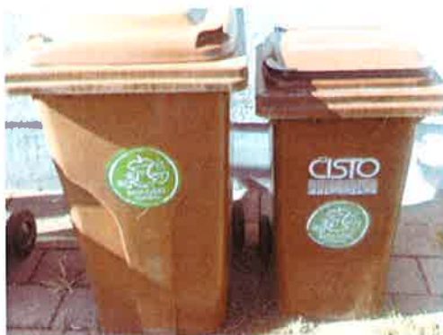
Fotografija 4: Posode za biološke odpadke