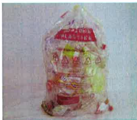
Fotografija 7: Vrečka za mešano embalažo

Za zbiranje steklene embalaže, uporabljamo plastične zabojnike, volumnov 240 l in 1100 l in sicer: