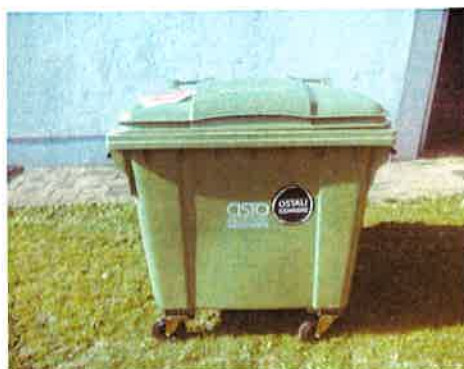
Fotografija 2 in 3: Posode za mešane komunalne odpadke