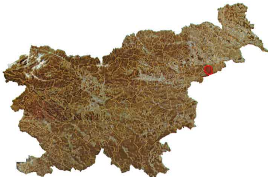
Slika 2: Lega občine Podlehnik