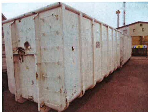
Fotografija 10 in 11: Kovinski kontejnerji