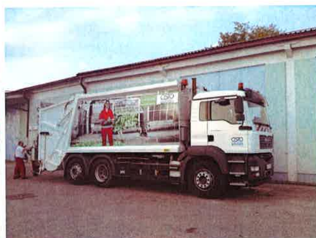
Fotografija 12 in 13: Smetarska vozila