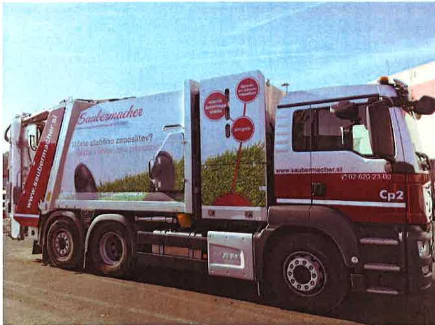
Fotografija 19: Vozilo za pranje zabojnikov za zbiranje bioloških odpadkov