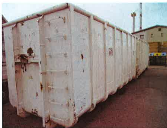
Fotografija 15 in 16: Kontejnerji različnih volumnov za zbiranje kosovnih in drugih odpadkov