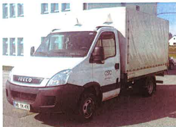
Fotografija 18: Vozila za prevoz in zbiranje nevarnih odpadkov

Za zbiranje in prevoz nevarnih frakcij uporabljamo specialna vozila, s pokritim kesonom in dovoljenjem za prevoz nevarnih snovi.