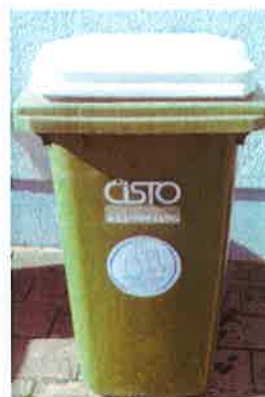
Fotografija 8 in 9: Posode za zbiranje stekla (steklene embalaže)