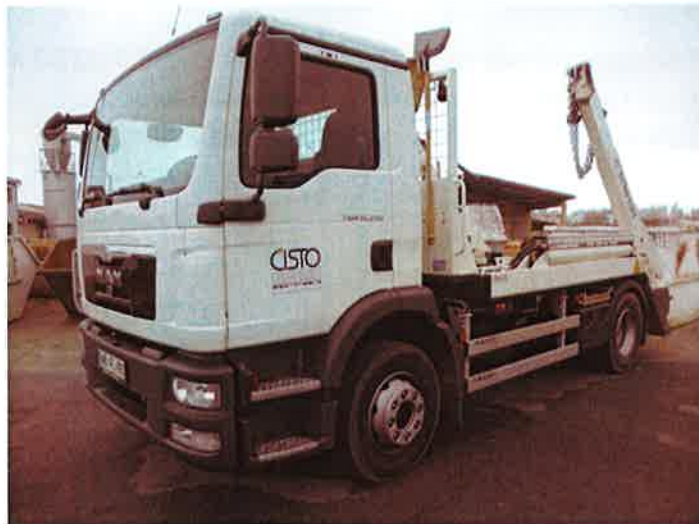
Fotografija 14: Vozilo za prevoz kontejnerjev

Za zbiranje in prevoz odpadkov iz zbirnih centrov, uporabljamo specialna komunalna vozila za odvoz kontejnerjev večjega volumna: