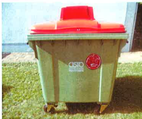
Fotografija 5 in 6: Posode za zbiranje papirja

Za zbiranje plastične embalaže ter ločenih frakcij iz plastike bomo uporabljali: