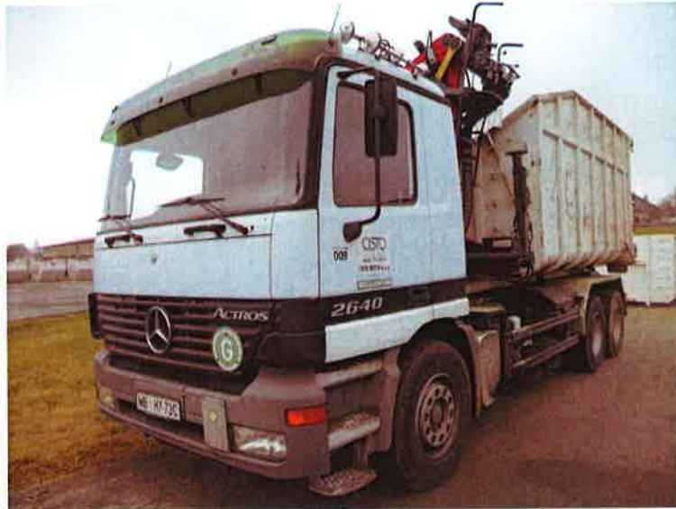
Fotografija 17: Vozilo za prevoz kotalnih prekucnikov

Za prevzemanje in prevoz kosovnih odpadkov uporabljamo kontejnerska vozila ter vozila za prevoz kotalnih prekucnikov.