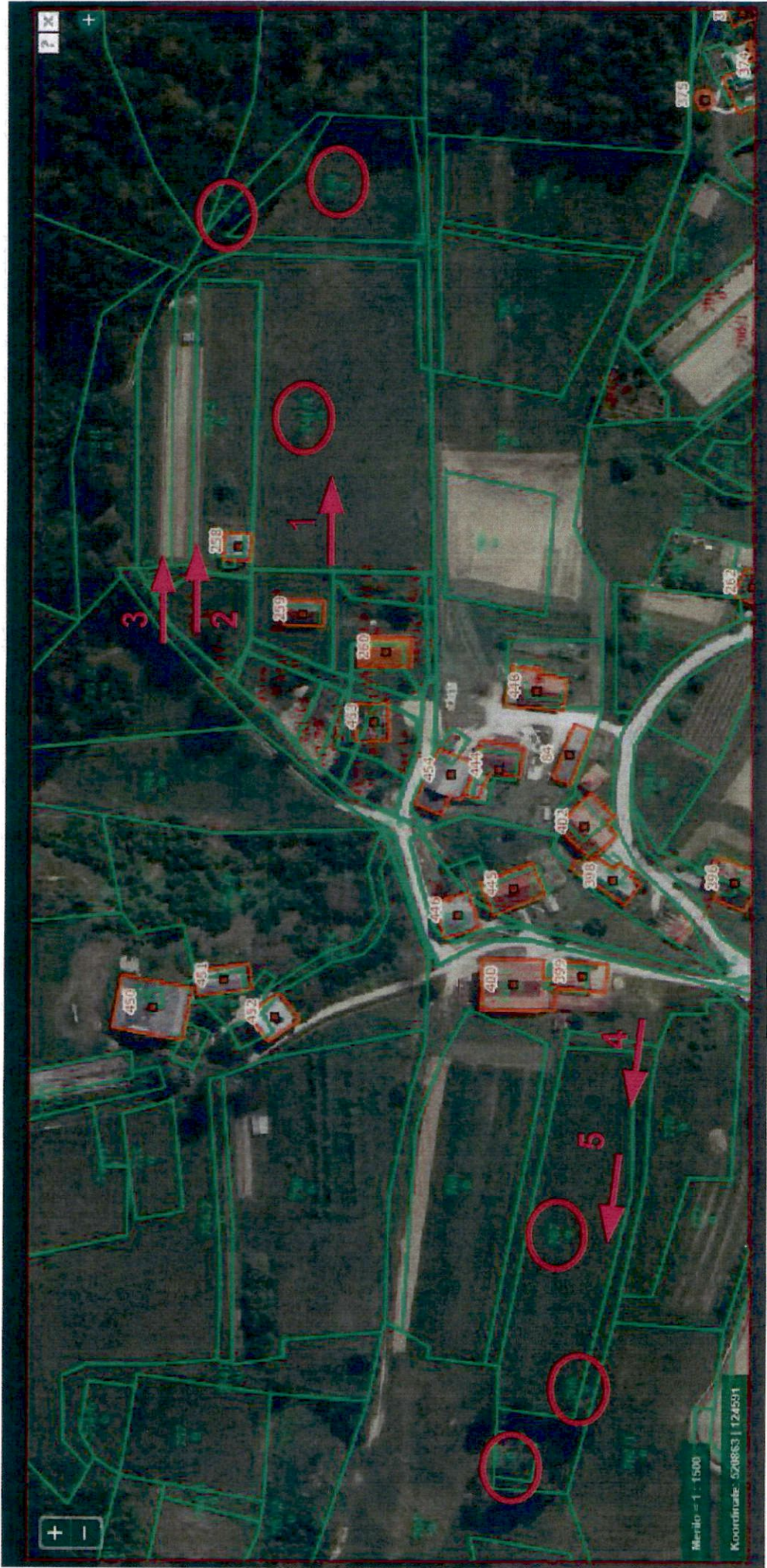
Parcele z ID znakom 1070 765, 1070 766 in 1070 767 Foto 4, 5