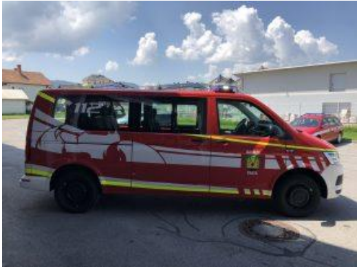
GVM-1 PGD Trata