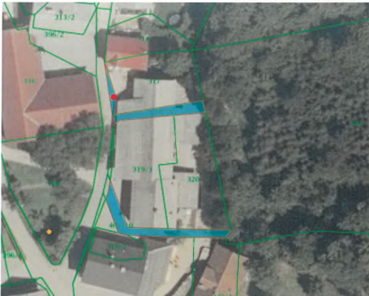
Parc. št. 397/1, 397/2 in 401/10 k. o. Srednja vas