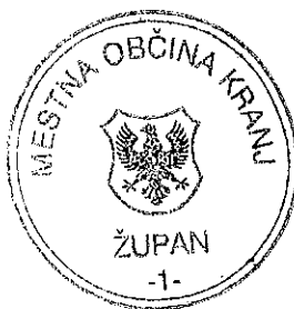
Boštjan Trilar ŽUPAN