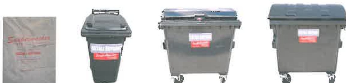
Slika 3 : Namenska embalaža za zbiranje mešanih komunalnih odpadkov