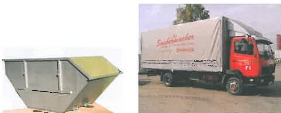
Slika 7 : Namenska embalaža in specialno vozilo za zbiranje kosovnih odpadkov