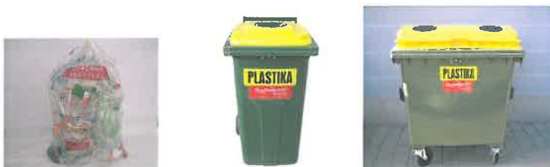
Slika 5 : Namenska embalaža za zbiranje plastične, kovinske, sestavljen in mešane embalaže