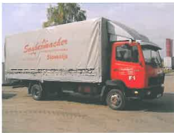
Slika 10 : Premična zbiralnica nevarnih frakcij