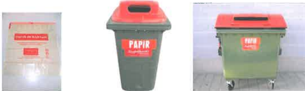
Slika 4 : Namenska embalaža za zbiranje papirja in papirne embalaže