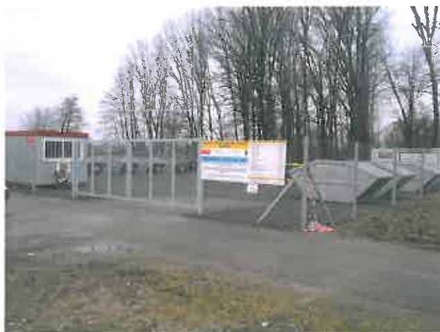
Slika 9 : Zbirni center ločenih frakcij Radenci

Zbirni center ločenih frakcij se nahaja v naselju Boračeva, na lokaciji pri stari žagi, parc. št. 55/3 in 55/5, k.o. Boračeva.