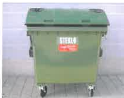
Slika 8 : Namenska embalaža za zbiranje steklene embalaže