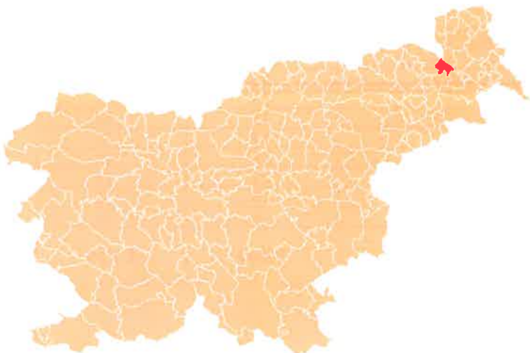
Slika 2 : Lega Občine Radenci v Republiki Sloveniji