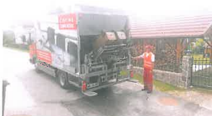
Slika 11 : Vozilo za pranje zabojnikov za zbiranje odpadkov

Če pride pri prevzemanju odpadkov do onesnaženja prevzemnega mesta oziroma mesta praznjenja embalaže in nalaganja odpadkov ali njihove okolice, mora izvajalec zbiranja komunalnih odpadkov na svoje stroške zagotoviti odstranitev teh odpadkov ter očistiti onesnažene površine.