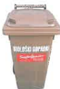
Slika 6 : Namenska embalaža za zbiranje biorazgradljivih odpadkov