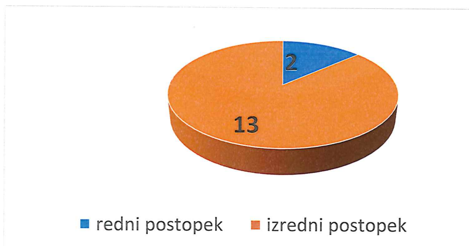
Slika 13: število novih zadev po načinu – Občina Mislinja

Opravili smo 13 izrednih nadzorov (87 %) in 2 redna nadzora (13 %).