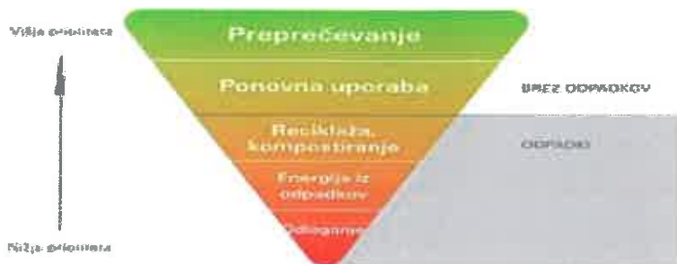
Slika 2: 5-stopenjska hierarhija ravnanja z odpadki