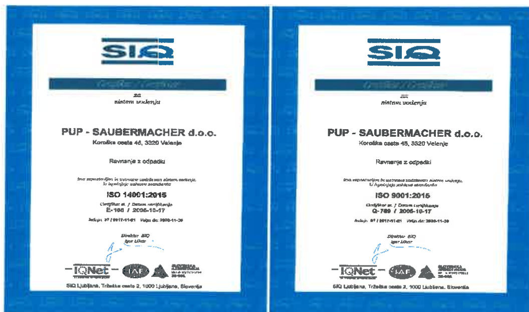
Slika 1: Certifikat 9001 in 14001

V podjetju PUP-Saubermacher smo se zaposleni obvezali, da bomo vsi, vsak na svojem področju in skupaj, uresničevali in izboljševali naš sistem dela. S tem prispevamo k uspešnemu delovanju podjetja, ki ima širši družbeni pomen. Podjetje PUP-Saubermacher d.o.o. deluje in posluje v skladu z zakonskimi zahtevami in smernicami mednarodnega standarda kakovosti ISO 9001:2015 in standarda ravnanja z okoljem ISO 14001:2015.