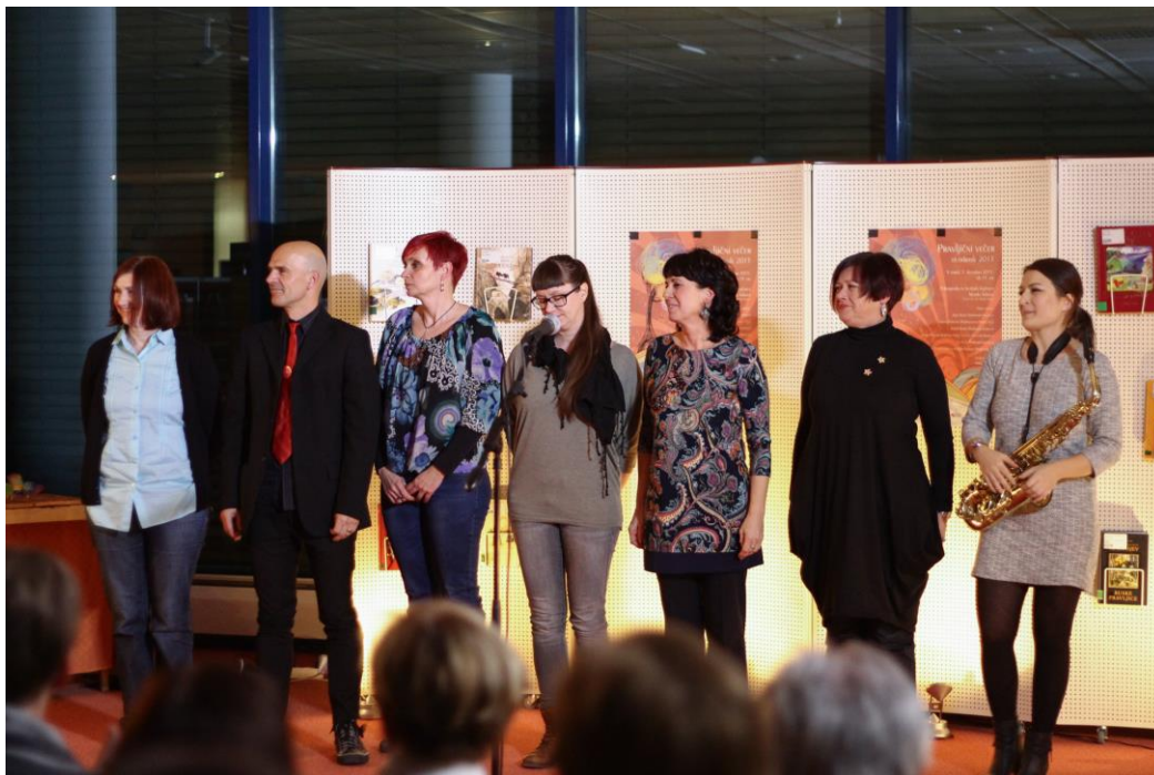
Slika 2: Pravljični večer za odrasle, 1. 12. 2015