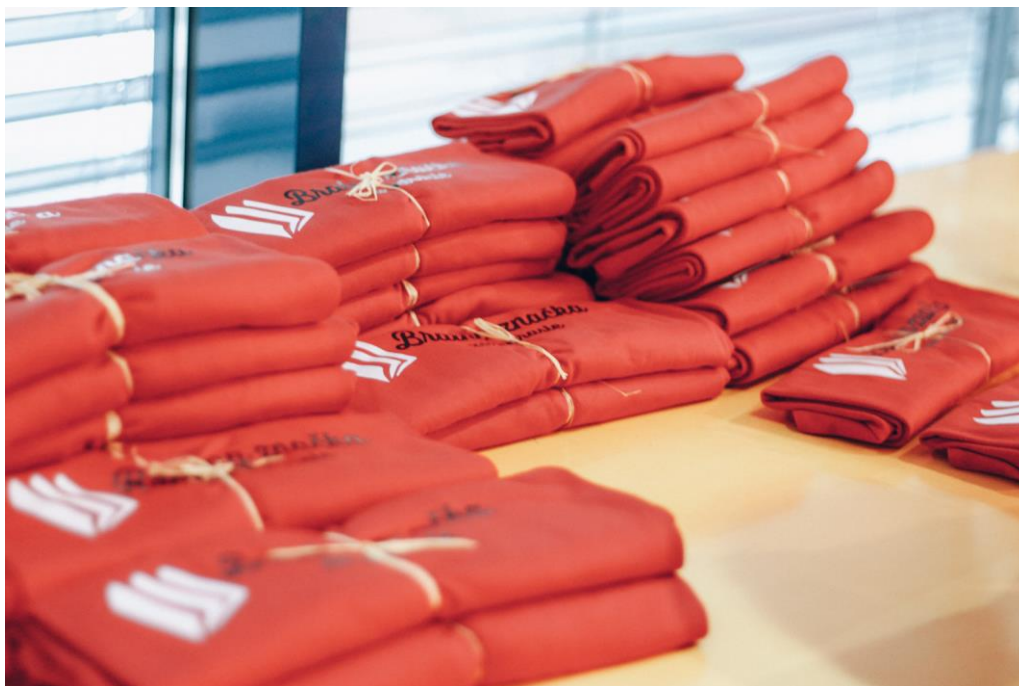
Slika 1: Zaključna prireditev Bralne značke, 3. 6. 2015.