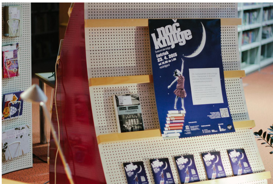
Slika 6: Noč knjige v Pišk, 23. 4. 2015