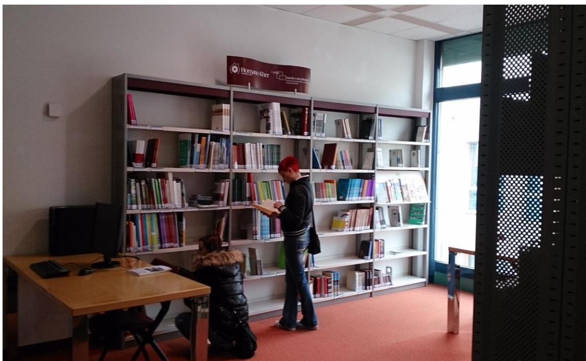
Slika 3: Romski oddelek, marec 2015

Pokrajinska in študijska knjižnica Murska Sobota je od februarja 2015 bogatejša tudi za romski oddelek, na kar smo še posebej ponosni, saj smo edina knjižnica na slovenskem ozemlju, ki se ponaša s tem oddelkom. Romski oddelek, ki se nahaja v prvem nadstropju knjižnice, je rezultat projekta Romano Kher - Romska hiša v sodelovanju z romskim društvom Phuro Kher - Stara hiša ter Pokrajinsko in študijsko knjižnica Murska Sobota. Na voljo je čez sedemsto enot knjižničnega gradiva z romsko tematiko, od knjig, DVD-jev in plošč do časopisov in drugega gradiva, ki je ustrezno obdelano in razporejeno. Ne manjkajo niti leposlovne in strokovne knjige v romskem jeziku avtorjev iz lokalnega in širšega evropskega prostora. Zbiranje gradiva se bo nadaljevalo tudi v prihodnje, saj le-to navsezadnje pomembno vpliva na knjižnično dejavnost kot tudi na spoznavanje romske kulture, jezika, zgodovine in njihove identitete.