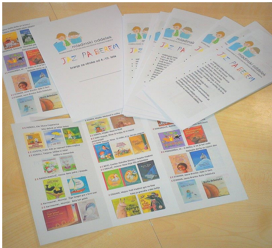
Slika 4: Povabilo k sodelovanju Jaz pa berem