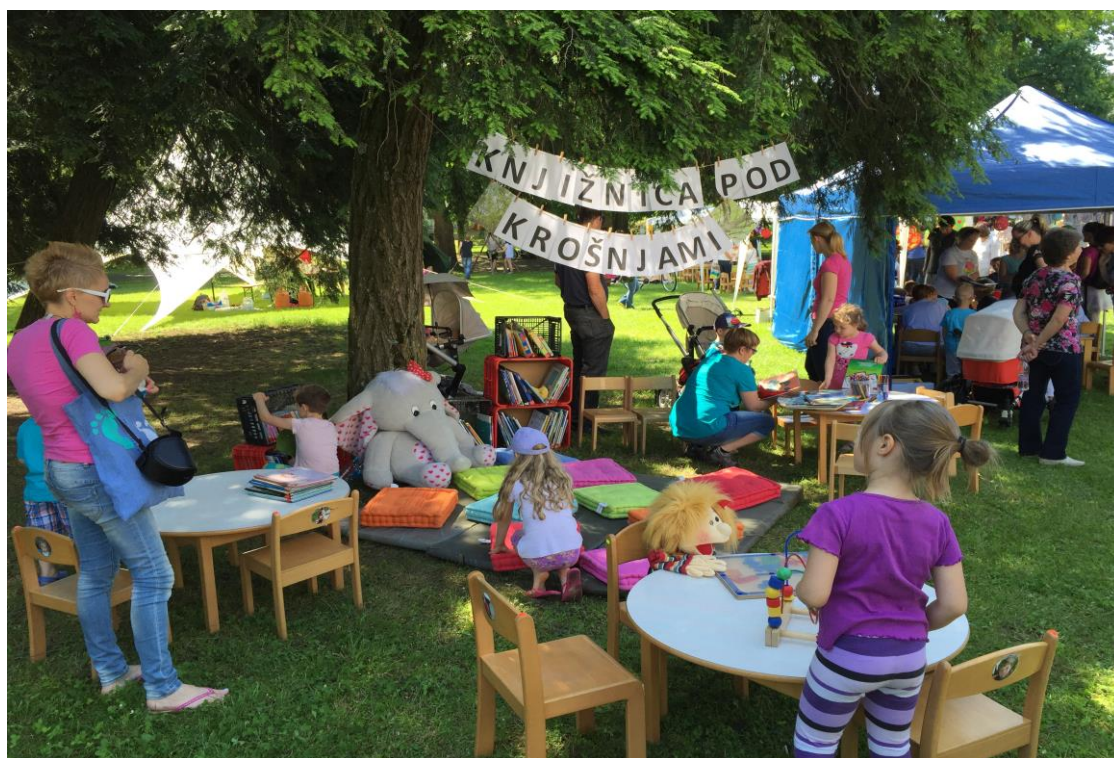
Slika 5: Knjižnica pod krošnjami na družinskem pikniku v mestnem parku, 30. 5. 2015