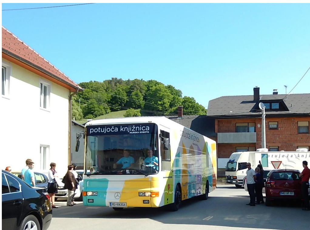
Slika 8: 20 let potujoče knjižnice, Grad, 8. maj 2015

Za kulturni program so poskrbeli učenci OŠ Grad z glasbeno točko in dramatizacijo Zmešnjava v deželi pravljic. Po strokovnem delu pa je sledil ogled razstave ob 20-letnici delovanja potujoče knjižnice v avli OŠ Grad in ogled gradu s strokovnim vodenjem.