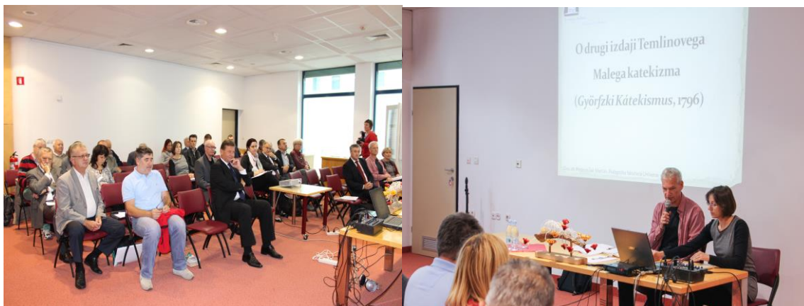
Slika 7: Mednarodni znanstveni simpozij, Pokrajinska in študijska knjižnica Murska Sobota, 8. 10. 2015