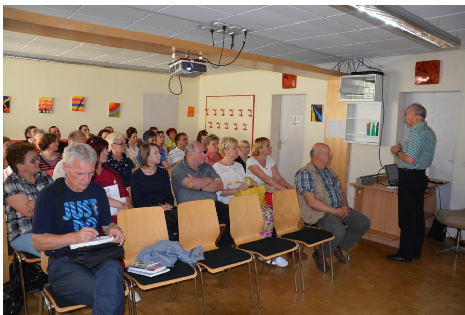
Slika 9: Strokovna ekskurzija z izobraževanjem, 25. 6. 2015