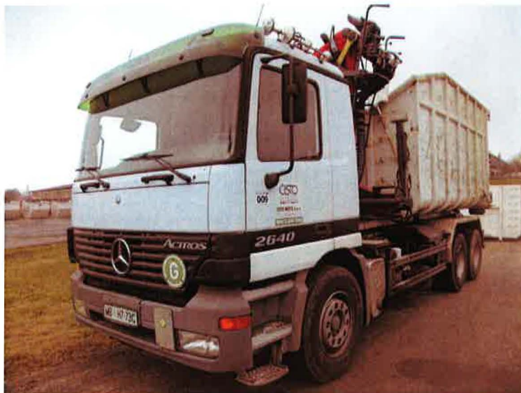
Fotografija 17: Vozilo za prevoz kotalnih prekucnikov

Za prevzemanje in prevoz kosovnih odpadkov uporabljamo kontejnerska vozila ter vozila za prevoz kotalnih prekucnikov.