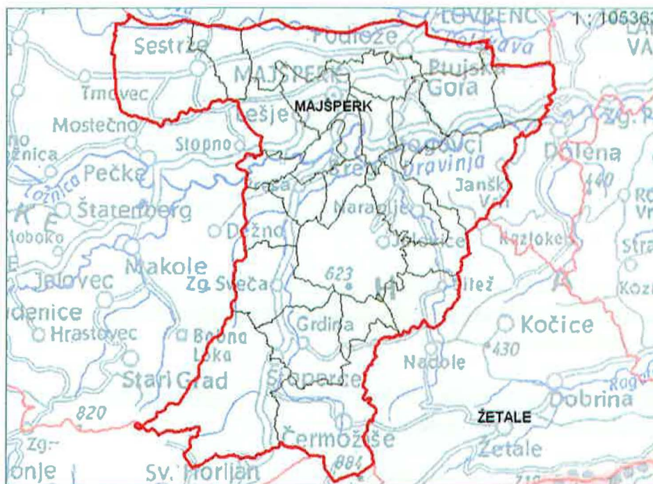
Slika 1: Zemljevid občine Majšperk