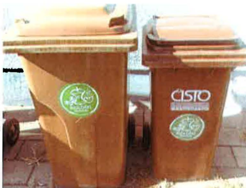
Fotografija 4: Posode za biološke odpadke