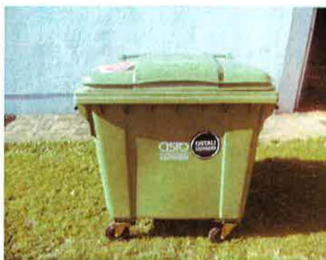
Fotografija 2 in 3: Posode za mešane komunalne odpadke