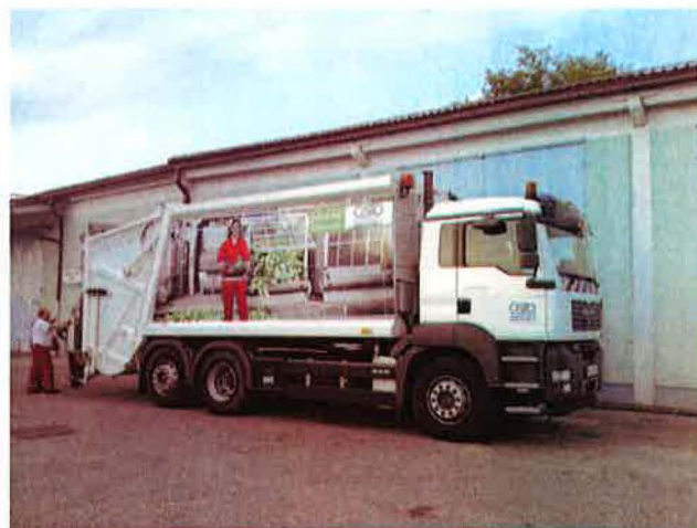
Fotografija 12 in 13: Smetarska vozila