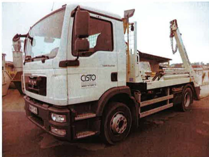
Fotografija 14: Vozilo za prevoz kontejnerjev

Za zbiranje in prevoz odpadkov iz zbirnih centrov, uporabljamo specialna komunalna vozila za odvoz kontejnerjev večjega volumna: