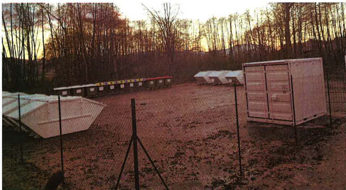
Fotografija 1: Zbirni center Majšperk

Datumi obratovanja zbirnega centra bodo navedeni na koledarju odvoza odpadkov ter na spletni strani https://cistemesto.si/zbirni-centri/ .