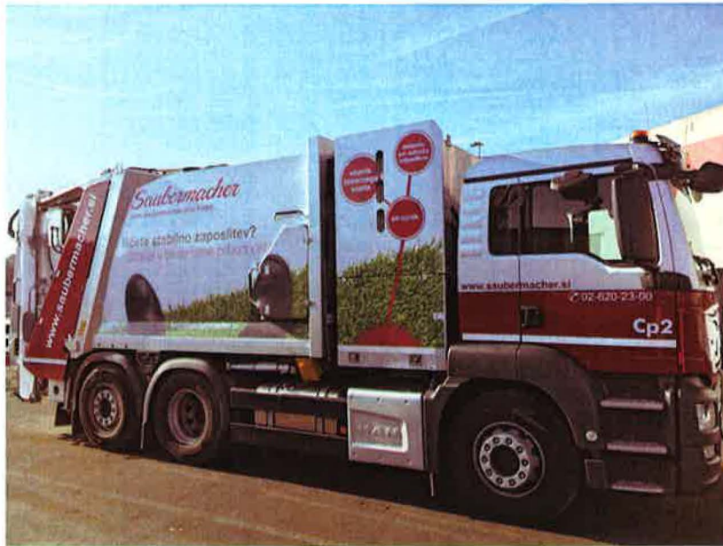
Fotografija 19: Vozilo za pranje zabojnikov za zbiranje bioloških odpadkov