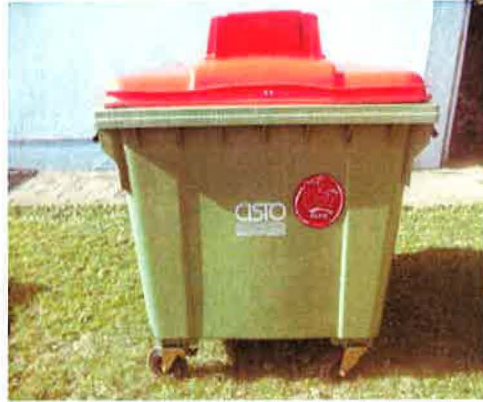
Fotografija 5 in 6: Posode za zbiranje papirja

Za zbiranje plastične embalaže ter ločenih frakcij iz plastike bomo uporabljali: