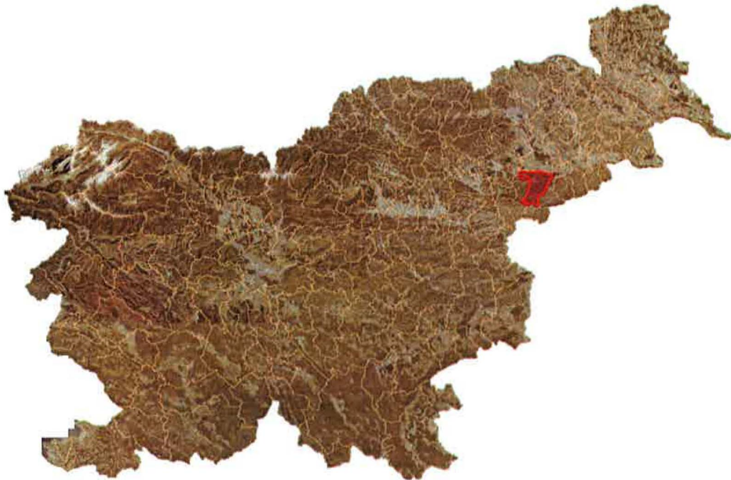
Slika 2: Lega občine Majšperk