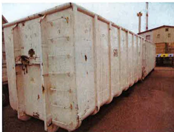
Fotografija 15 in 16: Kontejnerji različnih volumnov za zbiranje kosovnih in drugih odpadkov