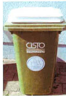
Fotografija 8 in 9: Posode za zbiranje stekla (steklene embalaže)