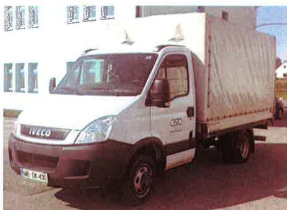
Fotografija 18: Vozila za prevoz in zbiranje nevarnih odpadkov

Za zbiranje in prevoz nevarnih frakcij uporabljamo specialna vozila, s pokritim kesonom in dovoljenjem za prevoz nevarnih snovi.