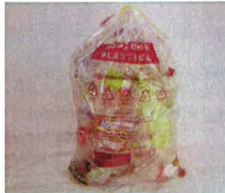
Fotografija 7: Vrečka za mešano embalažo

Za zbiranje steklene embalaže, uporabljamo plastične zabojnike, volumnov 240 l in 1100 l in sicer: