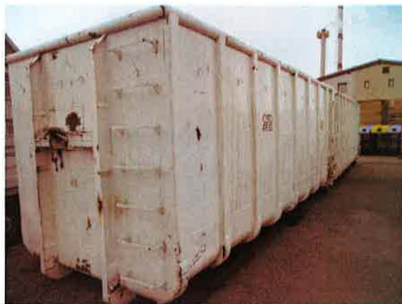
Fotografija 10 in 11: Kovinski kontejnerji