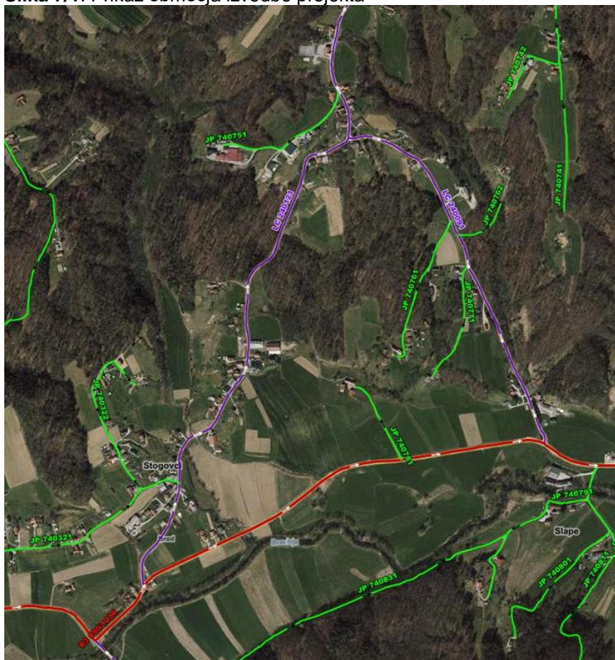
Slika 7/1: Prikaz območja izvedbe projekta

Investicija se bo izvedla na trasi kategorizirane lokalne ceste z oznako LC 240121 Stogovci – Ptujška Gora od priključka na regionalno cesto R3 690/1234 do priključka na javno pot JP 740751 Ptujška Gora – Zolar.