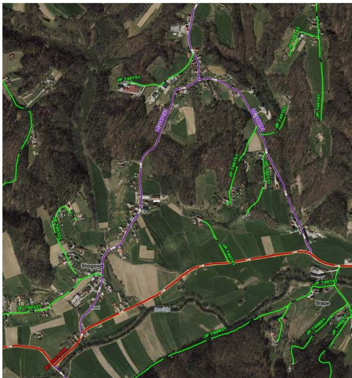
Slika 1: Prikaz območja izvedbe projekta