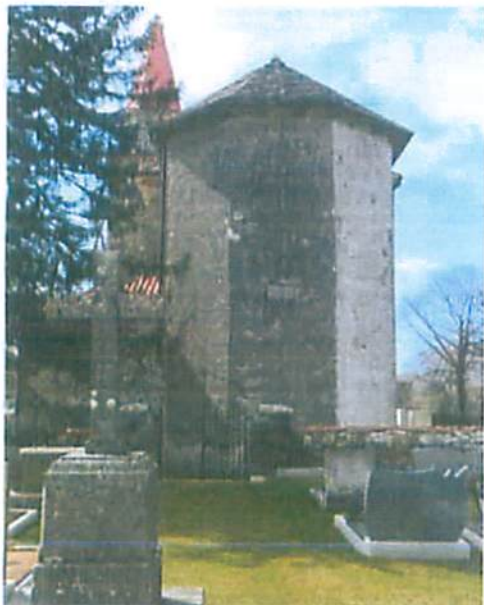
Gabrovica pri Komnu, slikano proti izhodu iz pokopališča

Za lažjo predstavo stanja pokopališč, smo naredili posnetek stanja in popisali prosta grobna polja. V občini Komen so na pokopališču Gabrovica pri Komnu še tri mesta namenjena novim grobnim poljem, smiselno bi bilo razmišljati o širitvi pokopališča.