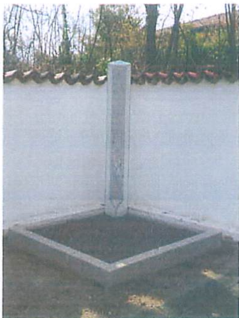
Novo postavljeno mesto za raztros na pokopališču Komen

Skozi celo leto kontroliramo stanje elektrike in vode, pri čemer smo pred zimskim časom z namenom preprečevanja zmrzali na vseh pokopališčih občine Komen vodo zaprli. Na pokopališčih v Volčjem gradu, Kobjeglavi, Gabrovici in Brestovici so bile zamenjane pipe (na potisk).