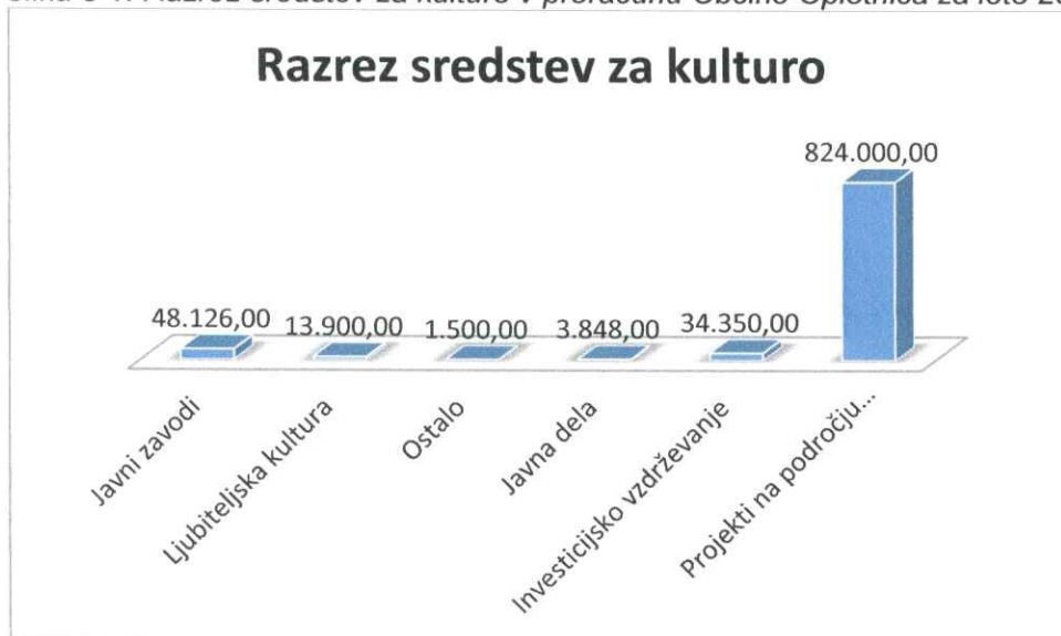
Slika 5-1: Razrez sredstev za kulturo v proračunu Občine Oplotnica za leto 2014

Največji delež javnega interesa v kulturi uresničujemo s projekti ohranjanja kulturne dediščine, z vzdrževanjem kulturne infrastrukture ter preko javnih zavodov, ob katerih pa delujeta dva kulturna društva in različne skupine. Zaradi velikega obsega delovanja ljubiteljske kulture in zagotavljanja podpore svoje naloge izvajajo tudi območna izpostava Javnega sklada RS za kulturne dejavnosti. Občina Oplotnica v proračunu zagotavlja sredstva za delovanje javnih zavodov in podporo ljubiteljski kulturi preko javnih razpisov. Višina proračunskih sredstev, namenjenih kulturi, se opredeli ob pripravi vsakoletnega proračuna.