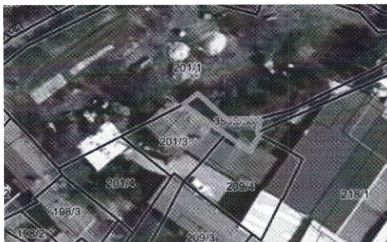
Parc. št. 3545/38 k.o. Komen