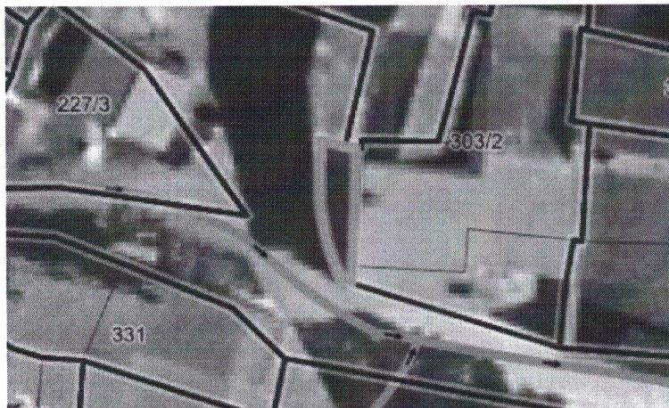
Parc. št. 305/11 k.o. Koboli

Z ukinitvijo javnega dobra bodo nastopili pogoji za razpolaganje z nepremičninami. Priloženi sklep o ukinitvi grajenega javnega dobra zato predajamo v obravnavo, s predlogom, da se ga sprejme.