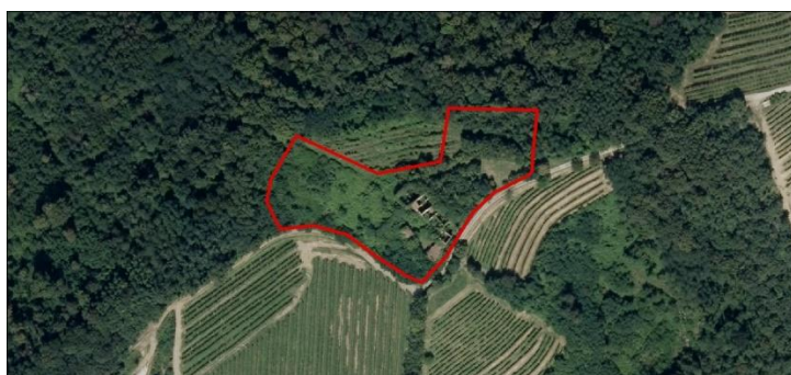
Grafični prikaz lokacije pobude na digitalnem ortofoto posnetku

Lokacijska preveritev se nanaša na enoto urejanja prostora NEB-01 SK, ki obsega parcelo 358/4 k.o. Neblo.