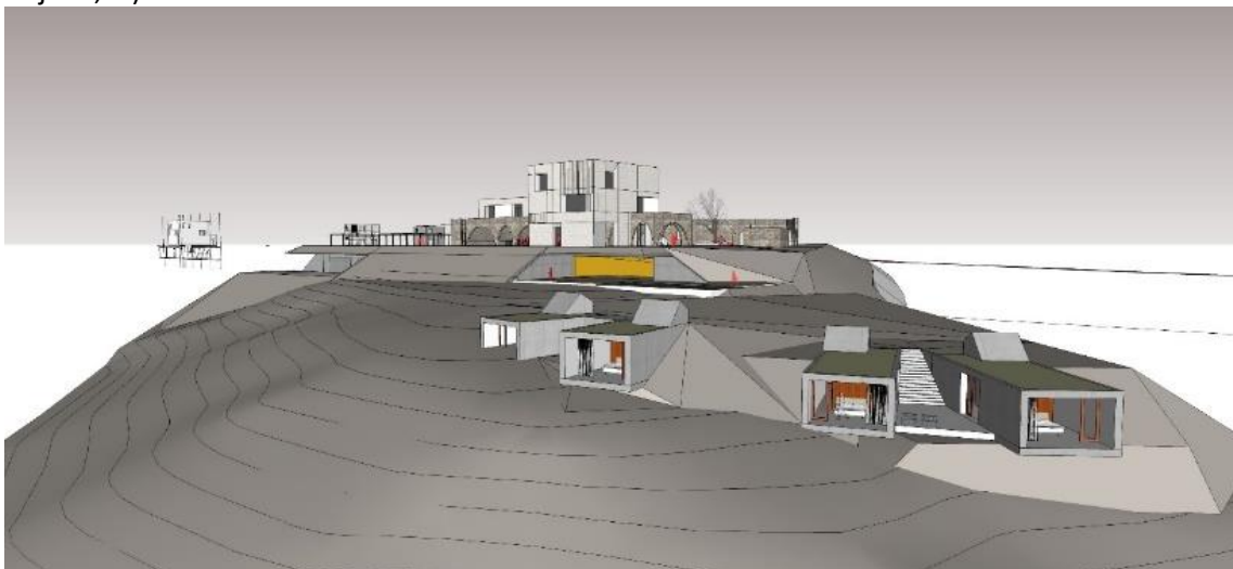
Prostorski prikaz nameravane investicije

skladišče, ...) s spremljajočim turistično-gostinskim programom (restavracija, velnes, nastanitveni objekti, ...).