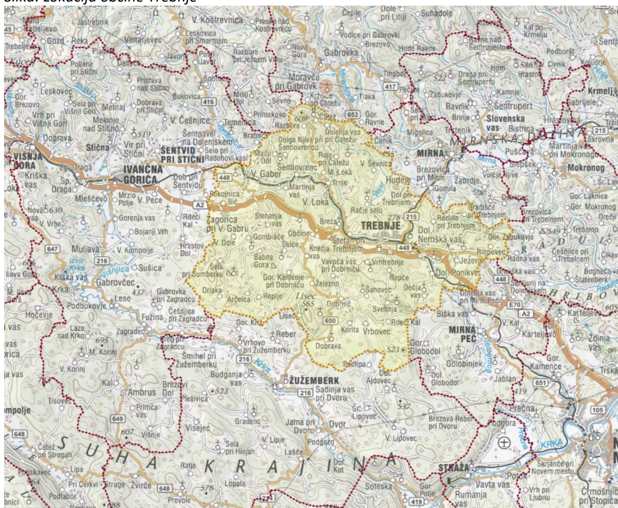
Slika: Lokacija občine Trebnje