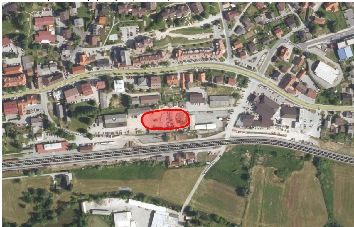
Slika: Lokacija investicije (ortofoto posnetek)