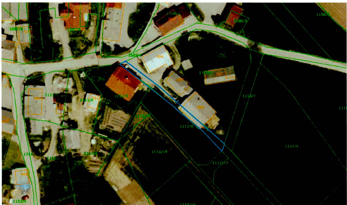
parc. št. 1716/5, k.o. 1409-Brezovica