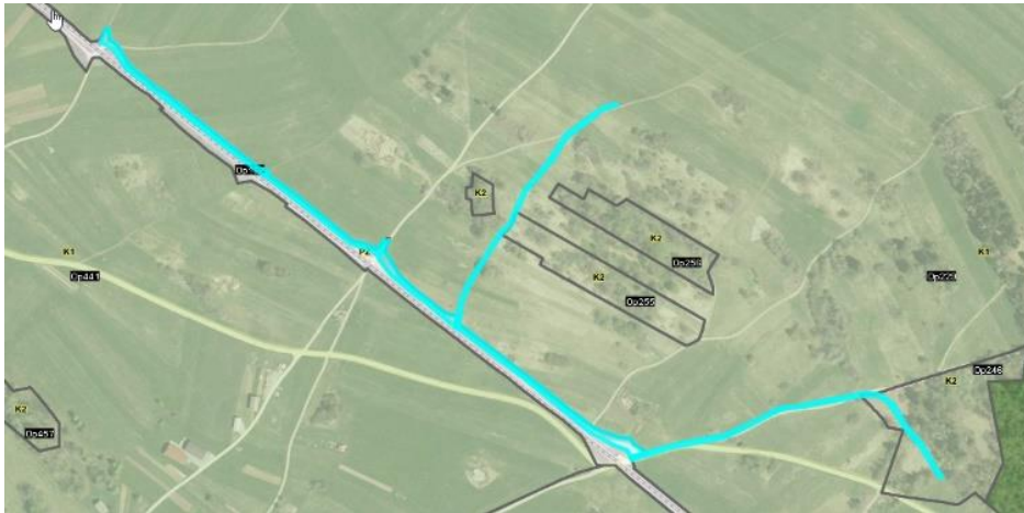
Geografski prikaz PISO, parcele 5304/8, 5304/13, 6197, 6198, 6199 in 6201, vse k. o. 1626 Goriča vas

Investitor mora za ta namen pridobiti služnostno pravico, ker pa so parcele javno dobro, na javnem dobrem pa se služnostne pravice ne more podeliti, je treba pred ustanovitvijo služnostne pravice javno dobro ukiniti in določiti lastnika – Občina Ribnica.