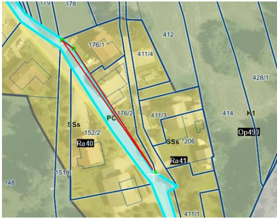
Geografski prikaz PISO, parcela 2312/2 k. o. 1630 Rakitnica