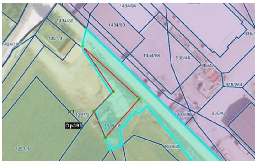
Geografski prikaz PISO, parcela 1434/14 k. o. 1625 Ribnica

V nadaljevanju bo odmerjeni del parcele predmet zamenjave za parcelo 1434/111 k. o. 1625 Ribnica, po kateri poteka občinska cesta JP odsek 852941 Ribnica – Zadolje.