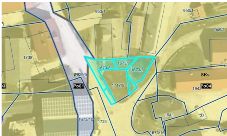
Geografski prikaz PISO, parcele 1673/8, 1673/7, 1673/9 in 1673/6, vse k. o. 1616 Velike Poljane

Parcele v naravi predstavljajo dvorišče in oz. gredo ob stanovanjskih hiši lastnikov, ki so zainteresirani za odkup. Parcele kot javno dobro ne služijo svojemu namenu.