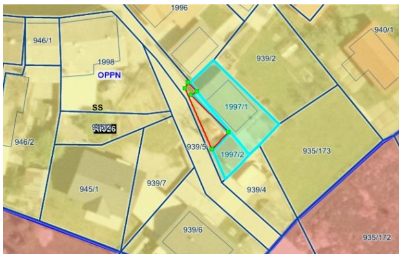
Geografski prikaz PISO, parcela 1435/12 k. o. 1625 Ribnica