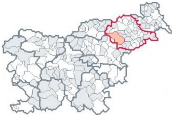
Slika 2-1: Podravska regija z občino Slovenska Bistrica

Koncentracija gospodarskih dejavnosti in prebivalstva na nekaterih območjih sta v preteklosti povzročila različne pogoje za življenje in delo (razlike v prostorski razporeditvi delovnih mest, stopnji brezposelnosti, v izobrazbeni strukturi prebivalstva), neustrezno prometno povezanost in neenakomerno dostopnost. Problemi so še posebej izraziti v strukturno zaostalih in ekonomsko-razvojno šibkih območjih s pretežno agrarno usmeritvijo, v območjih z demografskimi problemi, z nizkim dohodkom na prebivalca ter v ekonomsko in socialno nestabilnih območjih.