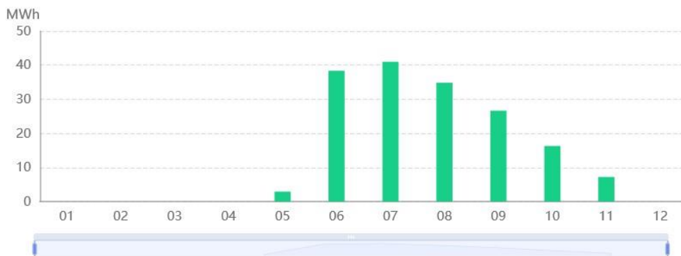
Diagram letne proizvodnje MFE CERO 260 KW, načrtovana proizvodnja za leto 2024 je 285 MWh.