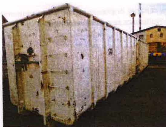
Fotografija 15 in 16: Kontejnerji različnih volumnov za zbiranje kosovnih in drugih odpadkov