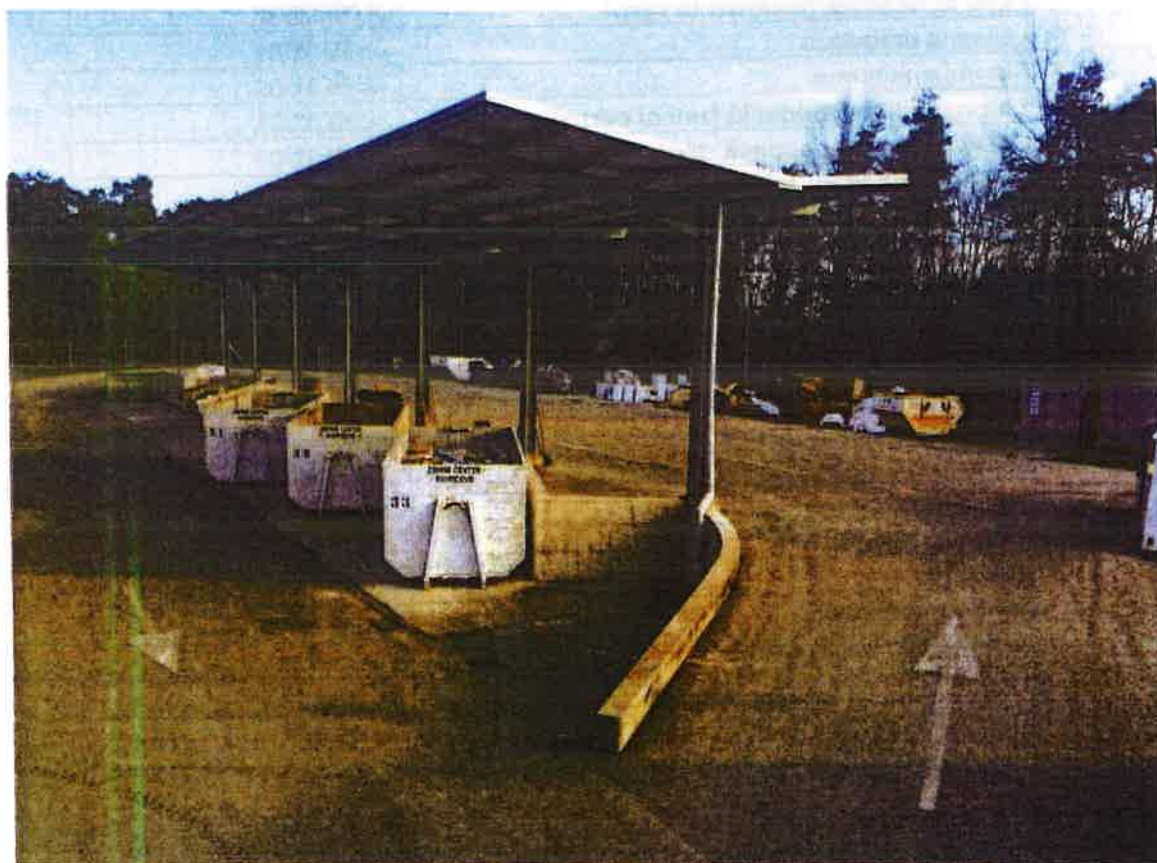
Fotografija 1: Zbirni center Kidričevo

Datumi obratovanja zbirnega centra bodo navedeni na koledarju odvoza odpadkov ter na spletni strani https://cistomesto.si/zbirni-centri/ .