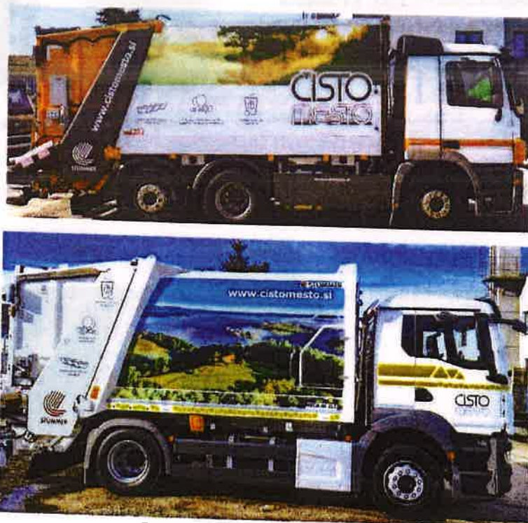
Fotografija 12 in 13: Smetarska vozila

Za zbiranje in prevoz komunalnih odpadkov na prevzemnih mestih pri povzročiteljih (Mešani komunalni odpadki, papir, mešana embalaža, biološki odpadki, steklena embalaža) uporabljamo specialna komunalna vozila: