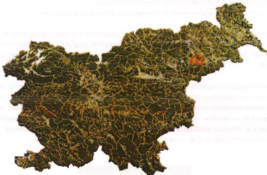
Slika 2: Lega občine Kidričevo