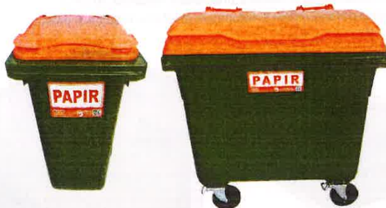
Fotografija 5 in 6: Posode za zbiranje papirja

Za zbiranje plastične embalaže ter ločenih frakcij iz plastike bomo uporabljali: