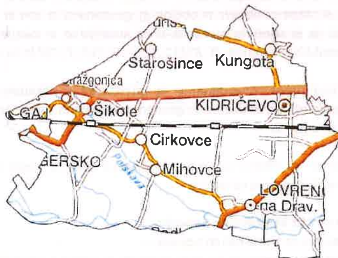
Slika 1: Zemljevid občine Kidričevo