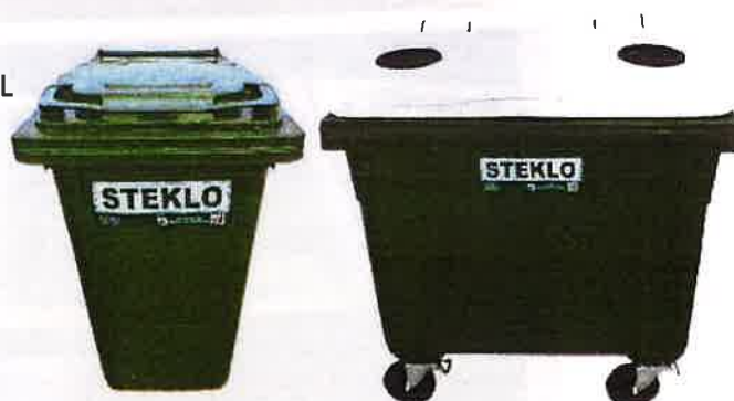
Fotografija 8 in 9: Posode za zbiranje stekla (steklene embalaže)