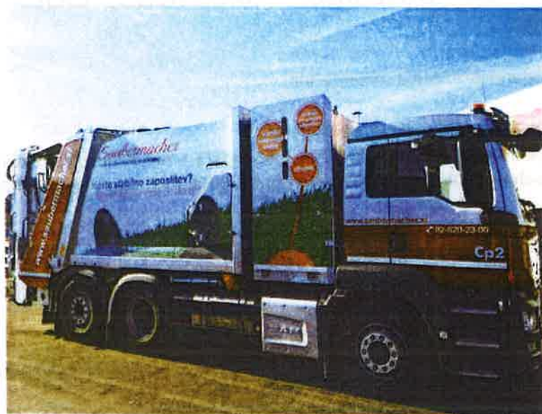
Fotografija 19: Vozilo za pranje zabojnikov za zbiranje bioloških odpadkov