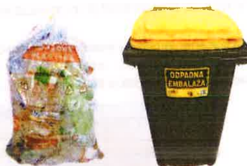
Fotografija 7: Vrečka za mešano embalažo

Za zbiranje steklene embalaže, uporabljamo plastične zabojnike, volumnov 240 l in 1100 l in sicer: