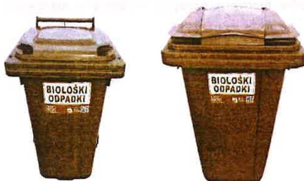
Fotografija 4: Posode za biološke odpadke