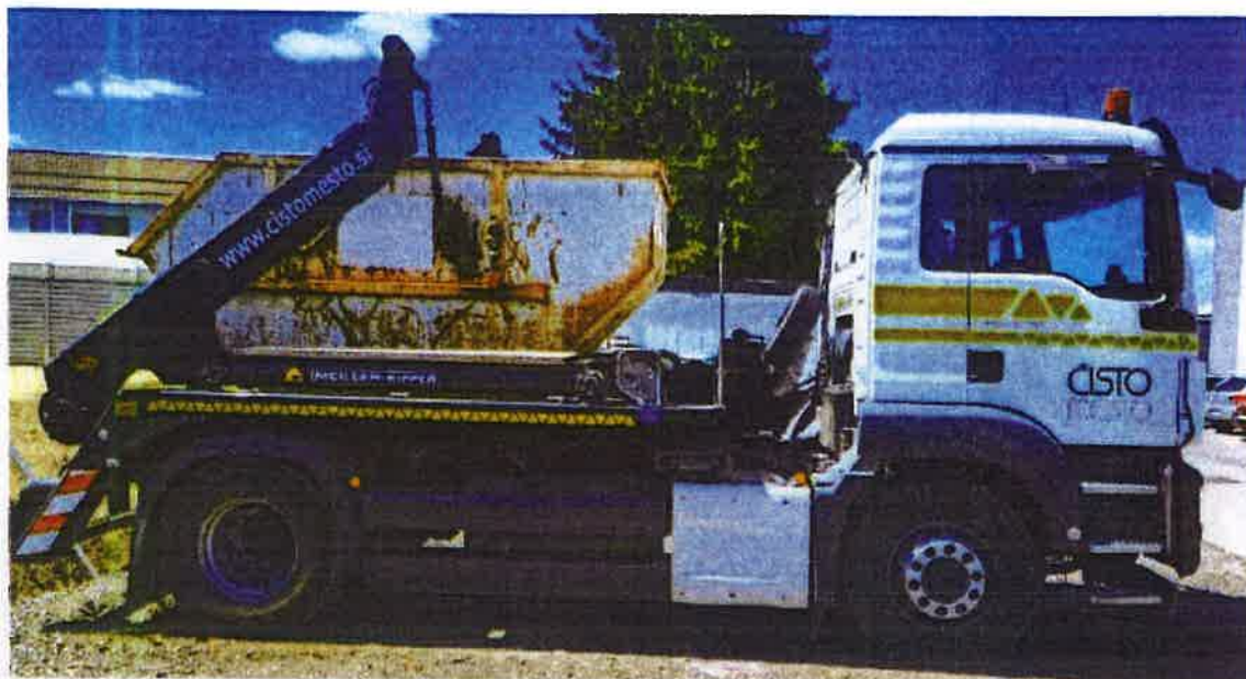
Fotografija 14: Vozilo za prevoz kontejnerjev

Za zbiranje in prevoz odpadkov iz zbirnih centrov, uporabljamo specialna komunalna vozila za odvoz kontejnerjev večjega volumna: