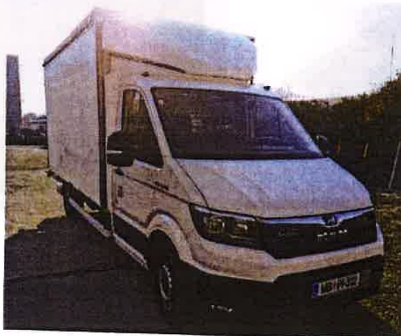
Fotografija 18: Vozila za prevoz in zbiranje nevarnih odpadkov

Za zbiranje in prevoz nevarnih frakcij uporabljamo specialna vozila, s pokritim kesonom in dovoljenjem za prevoz nevarnih snovi.