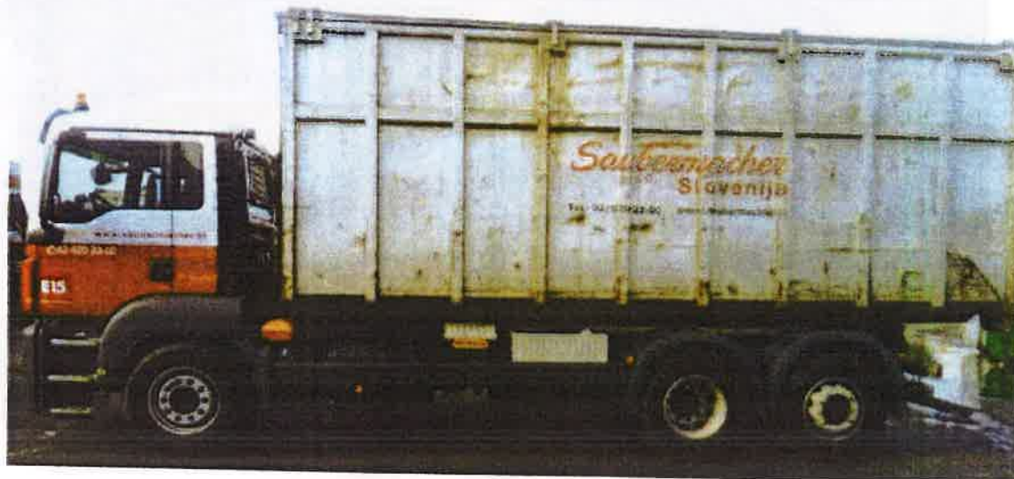
Fotografija 17: Vozilo za prevoz kotalnih prekucnikov

Za prevzemanje in prevoz kosovnih odpadkov uporabljamo kontejnerska vozila ter vozila za prevoz kotalnih prekucnikov.