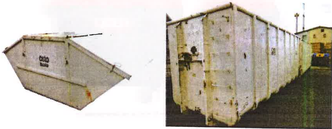
Fotografija 10 in 11: Kovinski kontejnerji