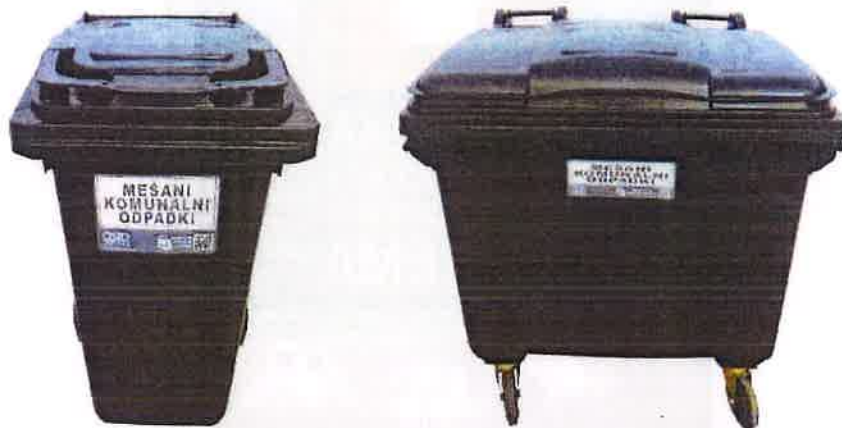
Fotografija 2 in 3: Posode za mešane komunalne odpadke