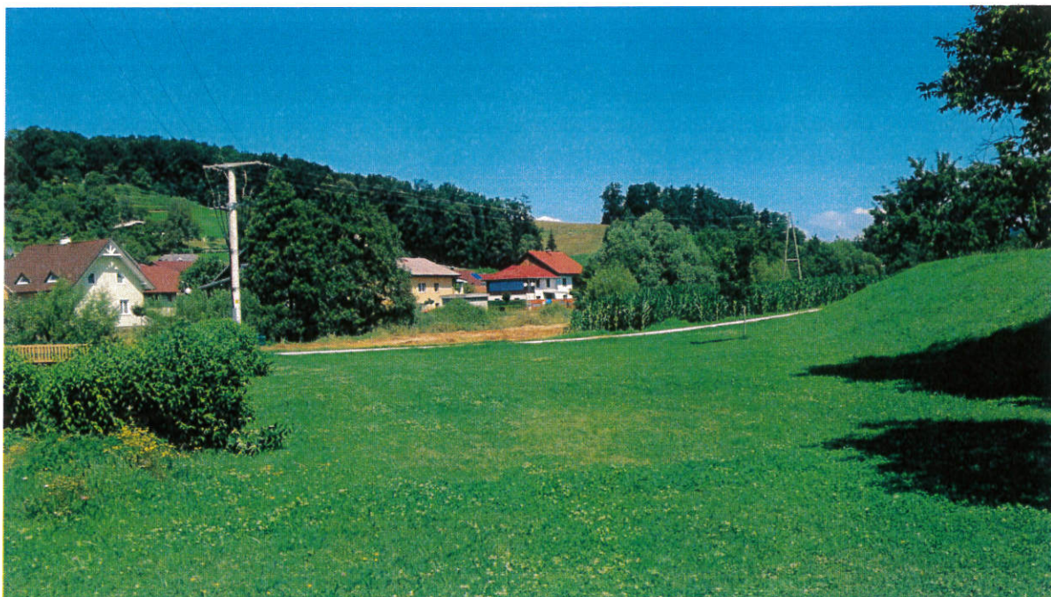
Slika 1: Lokacija predvidene umestitve Koloparka

Dostop je predviden s strani šolskega igrišča. Celoten poseg ne bo presegal omejitvev za nezahtevni objekt (1000 m 2 ).