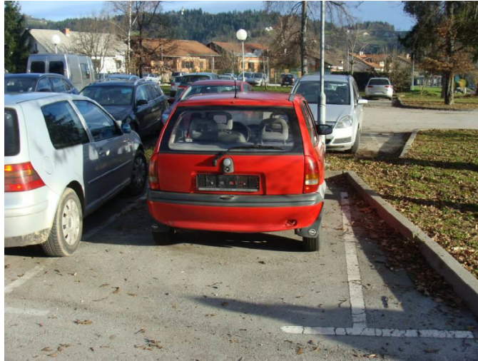
Slika: Zapuščeno vozilo na javnem parkirišču