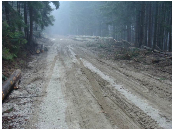
Slika: Onesnaženje/poškodba občinske ceste

Na območju Občine Zreče so občinski redarji in inšpektorica v letu 2014 izvajali naslednje ukrepe, ki so razvidni iz spodnje tabele: