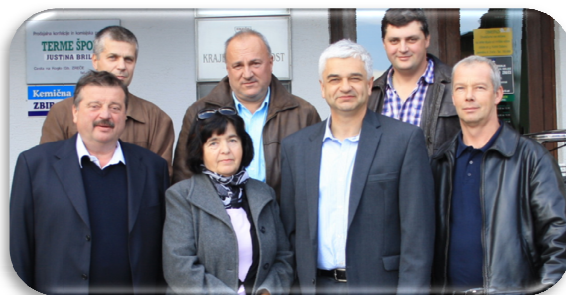
Slika 3: Novoizvoljeni predsedniki svetov krajevnih skupnosti v mandatnem obdobju 2014 – 2018