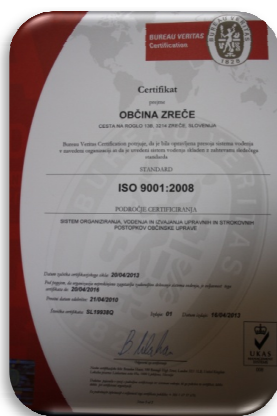
Slika 11: ISO certifikat

Ali smo pri svojem delu uspešni, učinkoviti, ali so občani oz. stranke z nami zadovoljni smo ugotavljali z anketami o zadovoljstvu uporabnikov s storitvami in z zaposlenimi na občinski upravi. Ankete so bile izvedene v letih 2011, 2013 in 2014. Zainteresiranost sodelovanja anketirancev pri teh anketah je povprečna, razen v letu 2011, ko je bila pripravljenost sodelovanja anketirancev pod povprečjem. Iz tega izhaja, da anketiranci ne želijo izraziti svojega mnenja niti takrat, ko jih občinska uprava prosi za sodelovanje. Očitno se premalo ljudi zaveda, da bi lahko na takšen način zagotovo določene stvari v delovanju občinske uprave (še) izboljšali. Rezultati anket so pokazali, da so občani v naši občini zadovoljni z oskrbo s pitno vodo ter urejenostjo javnih površin, nezadovoljni pa so z vzdrževanjem cest in odvajanjem in čiščenjem odpadnih in padavinskih voda. Nezadovoljstvo občanov oz. anketirancev se je izrazilo tudi v zvezi z delom občinske inšpekcije in redarstva ter v zvezi s hitrostjo in strokovnostjo postopkov na področju okolja in prostora ter stanovanjskih zadev.