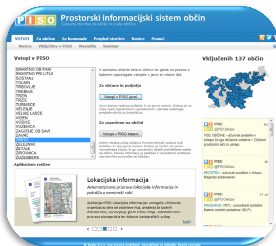
Slika 9: Dostop do PISO

Ta spletni pregledovalnik vsebuje celovito zbirko občinskih in državnih prostorskih vsebin, kot npr. prostorski načrt, katastra cestne in komunalne infrastrukture, turistične karte, katastra zemljišč in stavb, ortofoto pogled, poslovne subjekte ... Vse te vsebine so s pomočjo pregledovalnika na voljo zaposlenim na občini preko t. i. internega dostopa, občanom in podjetjem pa nudimo t. i. javni dostop, za kar je potreben zgolj na splet povezan osebni računalnik. Pred vstopom v sistem se je potrebno registrirati; registracija je brezplačna.