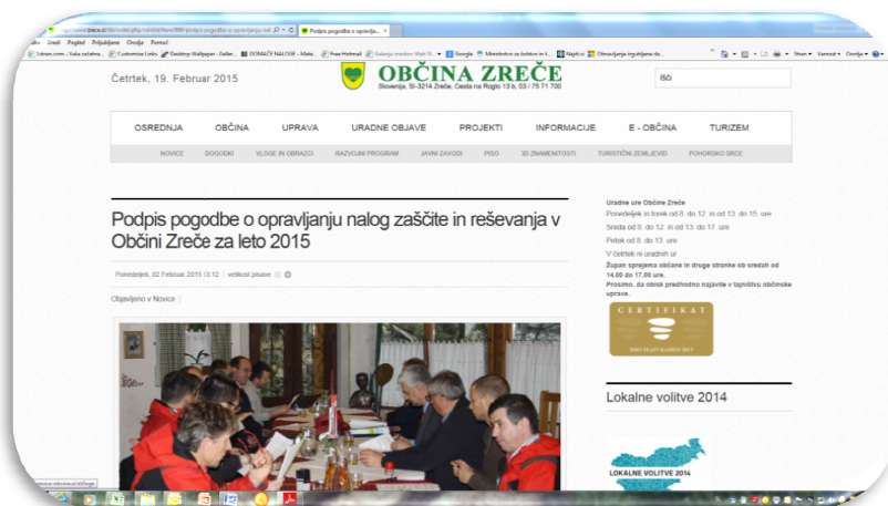
Slika 7: Izsek iz osrednje internetne strani Občine Zreče

V letih 2012 in 2013 smo spletno stran nadgradili s 3-dimenzionalnim zemljevidom z muzejskimi zbirkami in s cerkvami v Občini Zreče, v letu 2014 pa smo dodali še hotele.