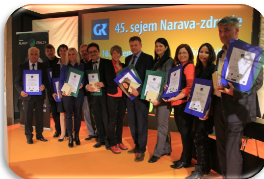
Slika 12: Prejemniki nagrad in priznanj Planetu Zemlja prijazna Občina

Občina Zreče je v svoji kategoriji prejela naziv: Planetu Zemlja prijazna občina 2014. Uradna podelitev naziva je potekala 13. 11. 2014 v okviru slavnostne otvoritve 45. sejma Narava – Zdravje na Gospodarskem razstavišču v Ljubljani.