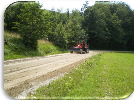
Slika 23 in 24: Sanacija dela ceste Zreče-Gračič-Malahorna

Sanacija odseka v dolžini 380 m na lokalni cesti Padeški vrh-Gorenje-Zg. Zreče pa je skupno znašala 82.118,00 EUR.