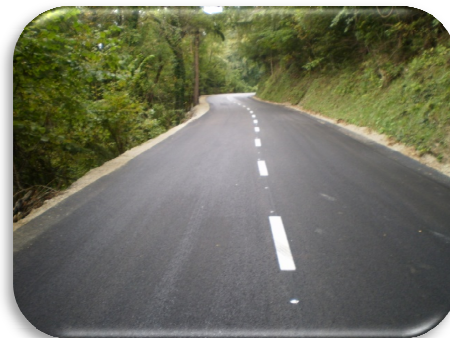
Slika 25 in 26: Sanacija dela ceste Padeški vrh-Gorenje-Zg. Zreče

Prav tako smo s sredstvi investicijskega vzdrževanja sanirali 976 m 2 ceste na Rogli proti stari koči. Sanacijska dela smo izvedli za 47.587,32 EUR.