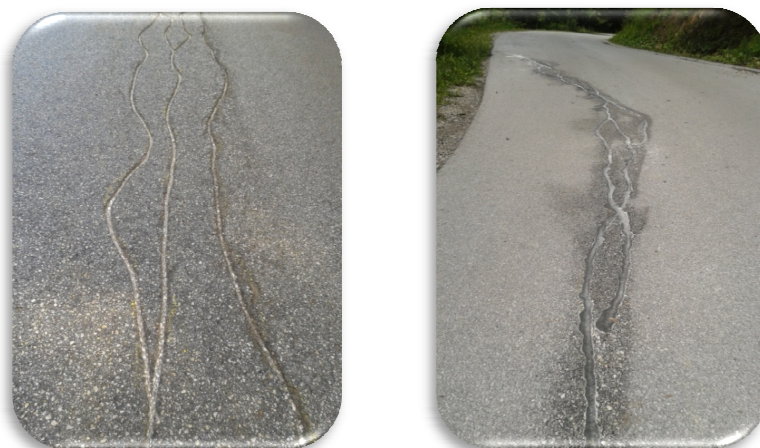
Slik 21 in 22: Sanacija razpok na vozišču, ki je še v dobrem stanju

V letu 2015 imamo za redno vzdrževanje lokalnih cest planirana sredstva v višini 272.000 EUR, od tega za zimsko vzdrževanje 120.000 EUR in za letno vzdrževanje 152.000 EUR.