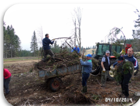
Slika 41 in 42: Čiščenje sečnih ostankov