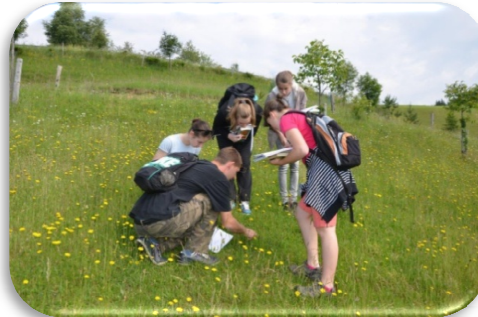
Slika 43 in 44: Mladi raziskovalci na delu