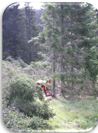
Slika 40: Čiščenje zarasti v namen revitalizacije pašnih planin

V letu 2014 smo zaključili z vsemi potrebnimi aktivnostmi, ki so bile načrtovane v okviru projekta ALPA. Za izvedene aktivnosti ter stroške plač, ki se nanašajo na delo na projektu je Občina Zreče v letu 2013 porabila 36.664,02 EUR, kar predstavlja 99,90% načrtovanih sredstev. V letu 2014 smo iz projekta prejeli povračilo stroškov 2. poročevalskega obdobja (EU del) ter 3. in 4. poročevalskega obdobja (nacionalni in EU del) v skupnem znesku 35.318,22 EUR (prihodek je knjižen na postavki 6M). V letu 2015 bomo prejeli še izplačilo 5 končnega poročanja v višini 26.548,44 EUR.