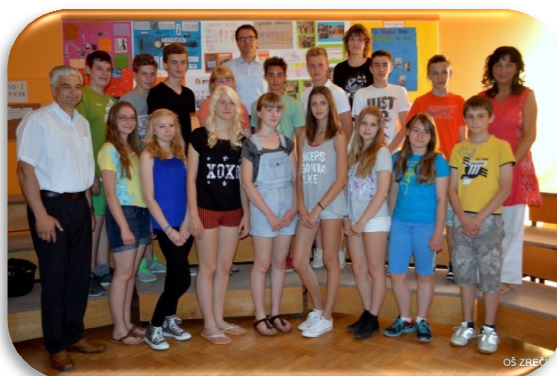
Slika 59: Sprejem odličnjakov, junij 2014

Vsako leto pogostimo najuspešnejše učence Osnovne šole Zreče ter dijake Srednje poklicne in strokovne šole Zreče – odličnjake vsa leta osnovnošolskega oziroma srednješolskega šolanja. V ta namen jim za njihov uspeh čestita župan Občine Zreče, prejmejo pa tudi simbolično darilo.