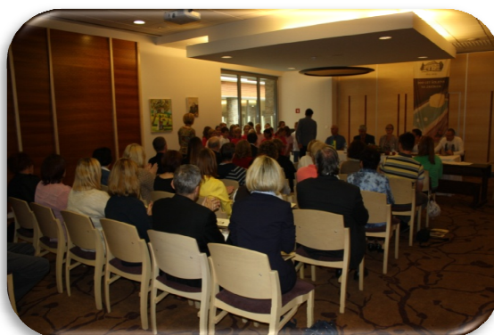
Slika 60: Novinarska konferenca ob začetku prazničnega leta

V letu 2015 bomo praznovali 200-letnico šolstva v Zrečah. V ta namen se bo v jubilejnem letu odvilo vrsto dogodkov, prav tako bo večina občinskih prireditev povezana s šolstvom. Začetek prazničnega leta smo odprli z novinarsko konferenco dne 4. 9. 2014, na kateri je bil predstavljen spored prireditev, ki se bodo odvijale v tem letu, med drugim je bila predstavljena tudi zgodovina šolstva, praznično leto pa bomo zaključili konec novembra 2015 s slovesno prireditvijo ob zaključku praznovanja. Izdani sta bili zloženko in mapa, v letu 2015 pa je predvidena izdaja zbornika o šolstvu na Zreškem, kjer bo podrobneje opisana zgodovina in šolsko dogajanje na vseh podružničnih šolah, tudi na nekdanjih šolah v Skomarju in Resniku ter strokovni šoli v Zrečah.