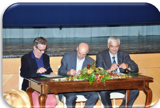
Slika 61: Svečan podpis listine ob odprtju 2. etape poti sv. Martina

Tako smo v septembru 2014 odprli drugi del poti sv. Martina v Sloveniji. Ta del poti poteka od Zreč do Logatca. Otvoritev poti je bila ob cerkvi sv. Martina v Zlakovi, nato pa je svečan podpis listine ob odprtju potekla v večnamenski dvorani hotela Dobrava Zreče.