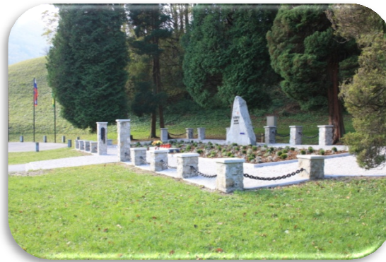
Slika 62: Grobišče 60 žrtvam po obnovi

V letu 2015 želimo izvesti 2. fazo obnove, t. j. obnova grobišča 40 žrtvam nacizma. V ta namen smo v proračunu že zagotovili sredstva, prav tako pa bomo za sofinanciranje ponovno prosili Ministrstvo za delo, družino in socialne zadeve.