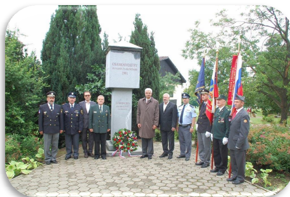
Slika 68: Položitev venca pri Spomeniku osamosvojitve Slovenije

Ob dnevu državnosti je župan Občine Zreče v spremstvu predstavnikov Veteranov vojne za Slovenijo, društva Sever ter Združenja borcev za vrednote NOB položil venec pri Spomeniku osamosvojitve Slovenije 1991.