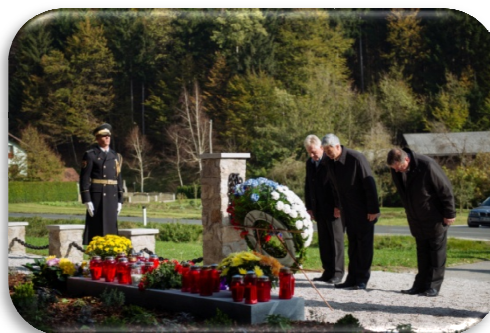
Slika 69 in 70: Komemoracija ob dnevu spomina na mrtve