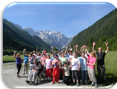
Slika 74 in 75: Varovanci Varstveno delovnega centra Slov. Konjice na pohodu