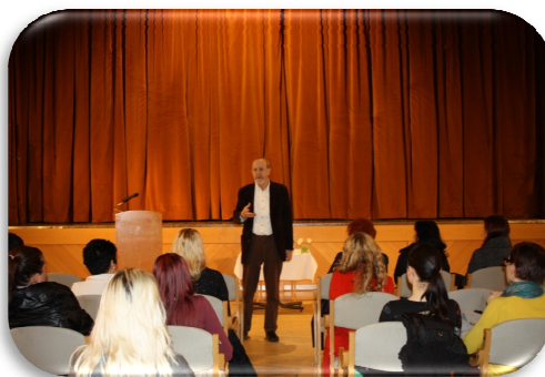
Slika 72: Predavanje Prosnika, mag. klin. psih.