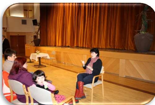
Slika 73: Zagotovitev tolmača v slovenski znakovni jezik na predavanju