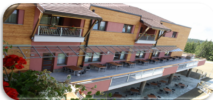
Slika 83: Pogled na teraso Hotela Natura