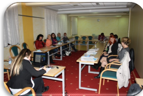
Slika 82: Utrinek iz izobraževanja