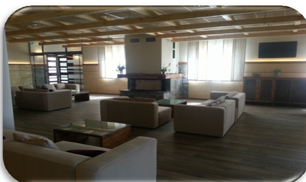
Slika 87: Avla hotela

V drugi polovici leta 2014 smo nadaljevali z gradnjo wellnessa v večnamenskem objektu na Rogli. Dela so zajemala gradbena dela in druga obrtniška dela, strojno instalacijska dela, elektroinstalacijska dela, bazensko tehnologijo, izdelavo in vgradnjo savn, izdelavo in montažo