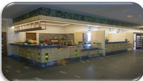
Slika 86: Kuhinja hotela