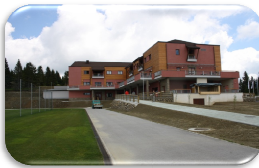
Slika 84 in 85: Hotel Natura