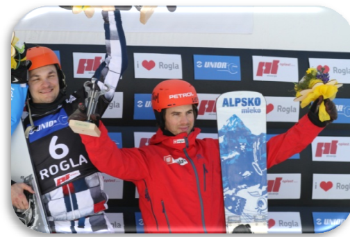
Slika 95 in 96: Utrinek s svetovnega pokala v deskanju na snegu