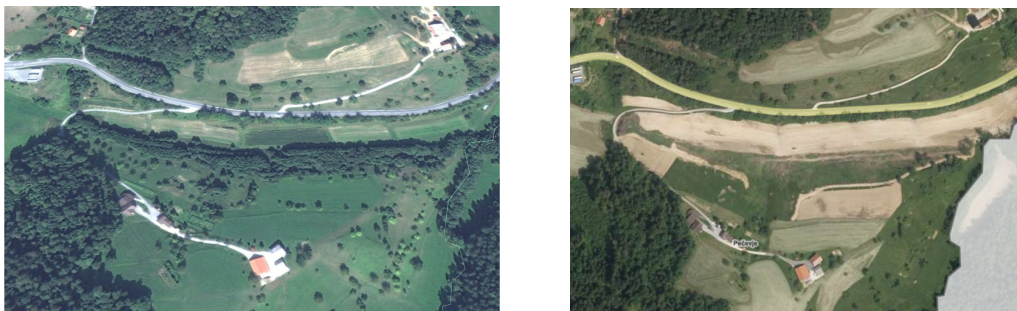
Slika 1 in 2: Lokacija plazu Konec