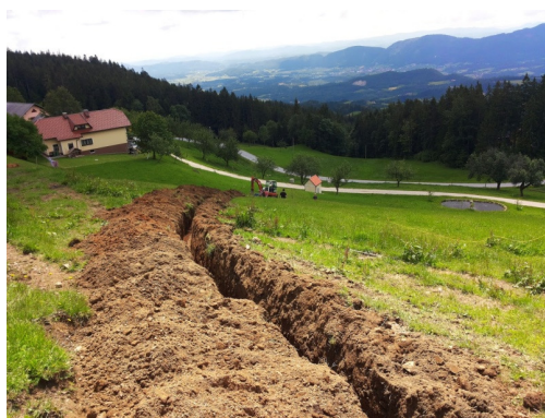
Slika 4: Izgradnja vodovodnega sistema na Planini na Pohorju

V želji po pridobitvi novih vodnih virov smo zgradili vodovodni sistem na Planini. V letu 2014 smo uredili črpališče (dve črpalki, vodovodne povezave,..), vodovodno povezavo (trasa vodovodne cevi) in električno povezavo (električni kabel). V letu 2015 (predvidoma do konca junija) bomo uredili merno mesto (pogodba, elektro omarice, krmiljenje) za električno napajanje in dokončali projekt. Zgraditev vodovodnega sistema bo omogočila povezavo s sistemom Zlakova in tako nadomestila sušo v poletnih mesecih na področju Zlakove in Brinjeve gore, prav tako pa bomo izboljšali kvaliteto vode na omenjenih področjih.