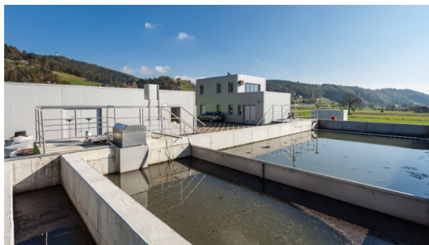
Slika 5: Čistilna naprava Zreče

bi morala biti zaključena do 18. 4. 2015. V januarju 2015 so bile izvedene zadnje meritve (četrtne meritve izpusta odpadnih vod) - monitoringov s strani pooblaščenih inštitucij, na osnovi katerih je bilo podano zaključno poročilo o delovanju ČN, ki smo ga na Občino Zreče prejeli 3. 3. 2015. Nadzornik je nato dne 3. 4. 2015 izdal mnenje nad poskusnim obratovanjem objekta ČN Zreče, kateri je podlaga za izdajo uporabnega dovoljenja. Upravna enota Slov. Konjice je izdala sklep o zaključnem tehničnem pregledu objekta - komunalna čistilna naprava Zreče 8500 PE, ki je bil 23. 4. 2015 na kraju samem. Izvajalec del je 8. 4. 2015 predal na Občino Zreče poslovnik in navodila o obratovanju in vzdrževanju ČN Zreče. Nadzornik pa je izdal nato še potrdilo o prevzemu del z dne 15. 4. 2015, s čimer je tudi ČN Zreče prešla v upravljanje Režijskega obrata Občine Zreče. Od prevzema je začela teči tudi garancija doba, za katero je bila izdana bančna garancija za dobro in pravočasno izvedbo del, ki se zaključi z 18. 7. 2016.