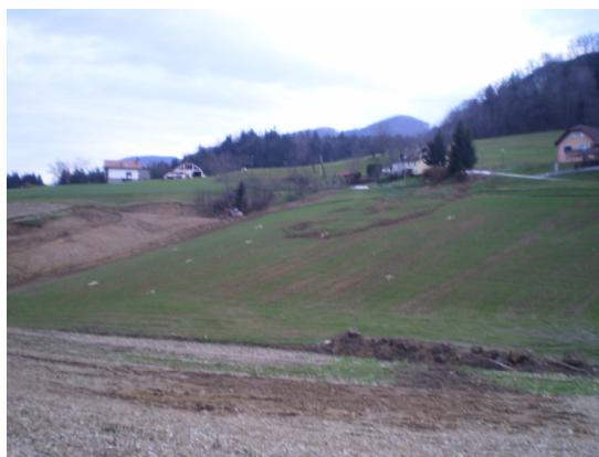
Slika 3: Plaz Konec

Pripravil: Andrej Furman, svetovalec za investicije in komunalne zadeve na Občini Zreče