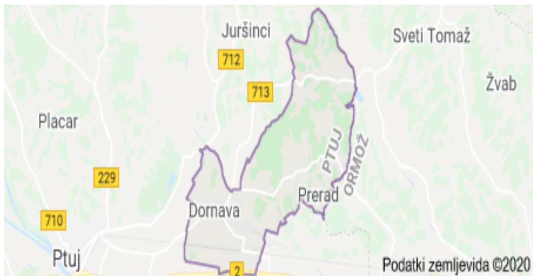
Slika 1: Območje občine Dornava

Občina je razdeljena na štiri vaške odbore in sicer Vaški odbor Dornava, Vaški odbor Mezgovci ob Pesnici, Vaški odbor Polenšak in Vaški odbor Žamenci.