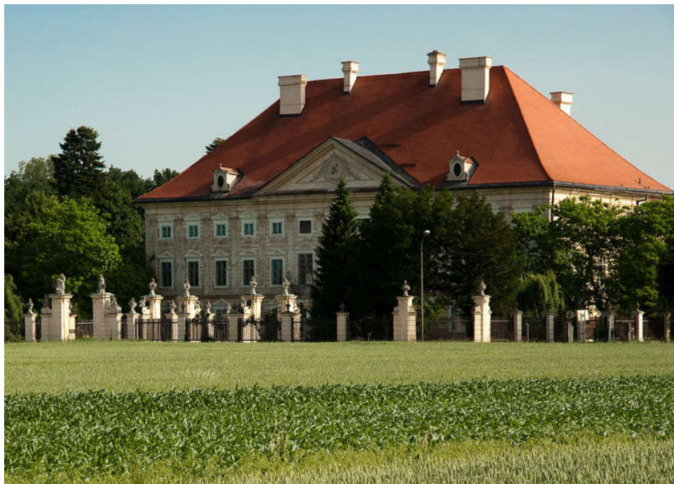
Slika 2: Pogled na dvorec Dornava

Omenjeni dvorec je največji ravninski baročni dvorec in ena najlepših posvetnih stavb poznega baroka pri nas.