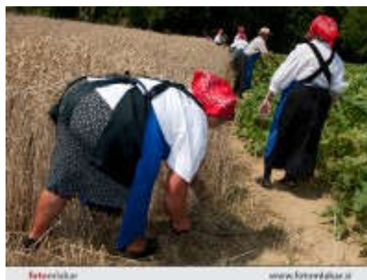
Slika 3: Prikaz tradicionalnih občinskih prireditev