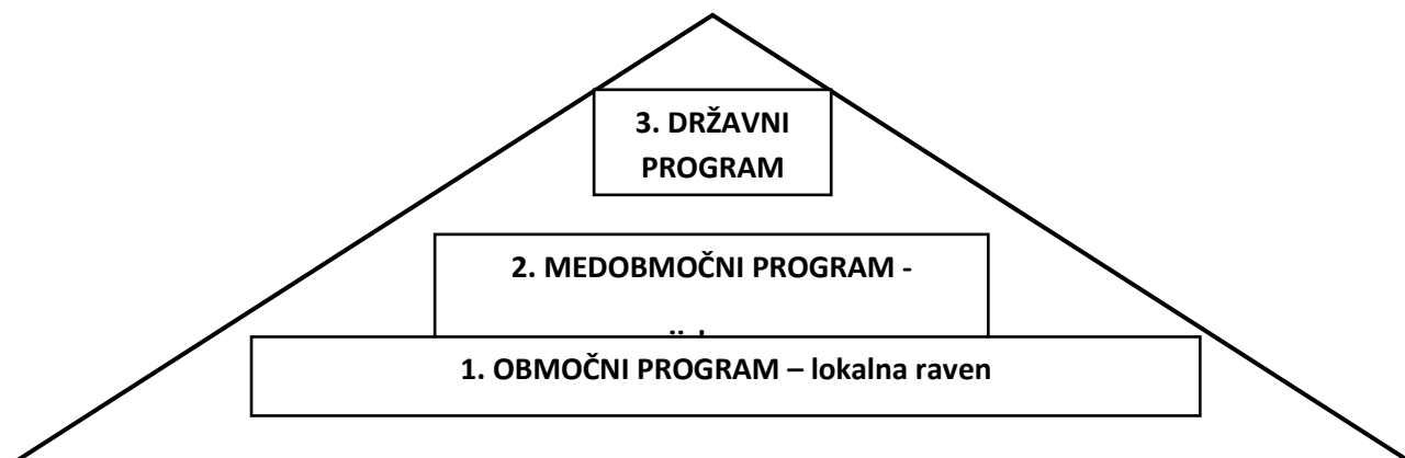
Piramidna programska shema JSKD

Prireditve so namenjene predstavitvi, primerjavi in vrednotenju dosežkov ljubiteljskih kulturnih društev, skupin in posameznikov. Nastope spremljajo strokovnjaki za ustrezna področja, ki analizirajo predstavljeno delo in svetujejo metode dela. Hkrati izbirajo kvalitetne kandidate za udeležbo na prireditvah medobmočne oz. državne ravni.