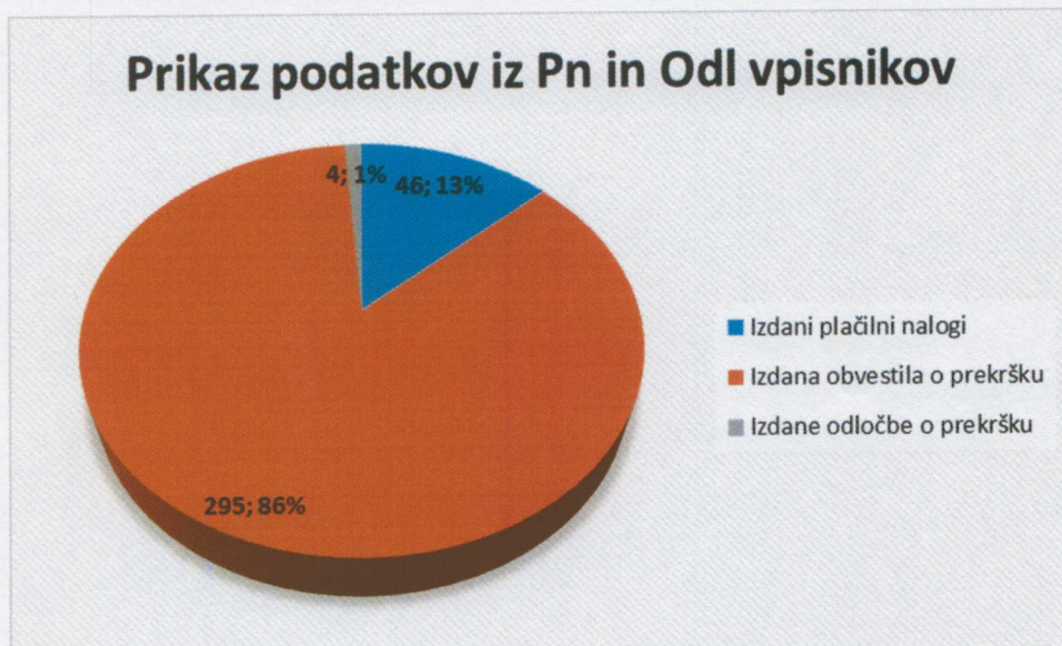
Graf 2: Prikaz podatkov iz Pn in Odl vpisnikov za leto 2017