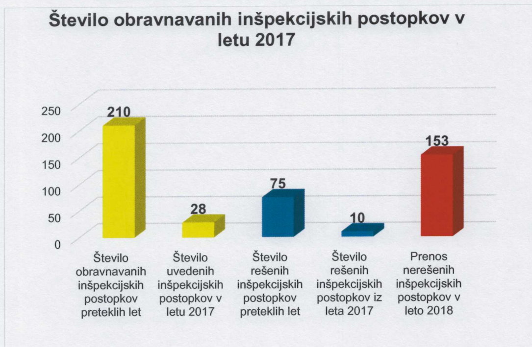
Graf 4: Število obravnavanih inšpekcijskih postopkov v letu 2017

Prometa (priliva) iz naslova denarnih kazni v upravni izvršbi je bilo v leto 2017 (2016) v višini 350,00 (1.100,00) eurov.