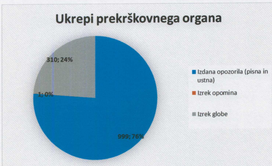
Graf 3: Ukrepi prekrškovnega organa