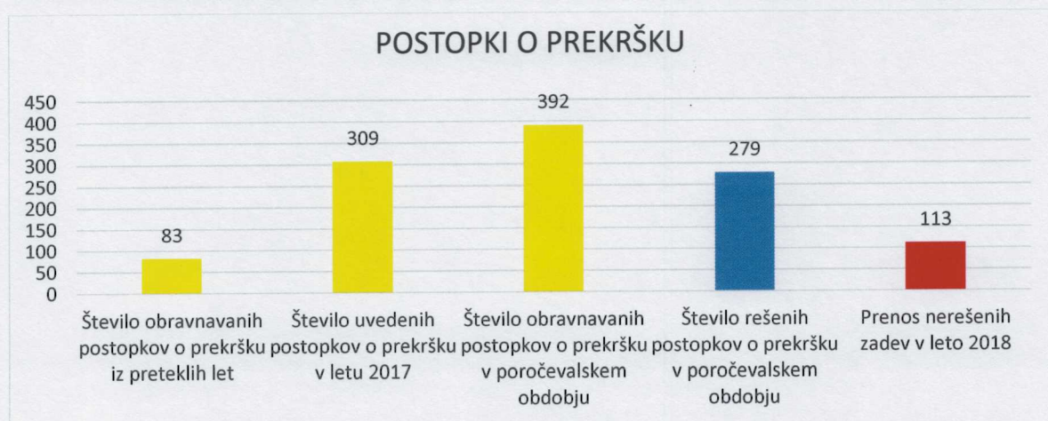
Graf 1: Prikaz podatkov iz Pn in Odl vpisnikov za leto 2017 – POSTOPKI O PREKRŠKU