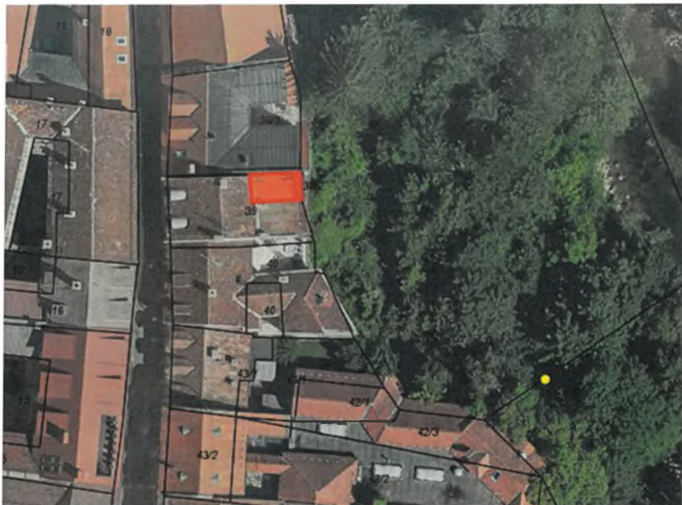
Parc. št. 38/2, k. o. Kranj