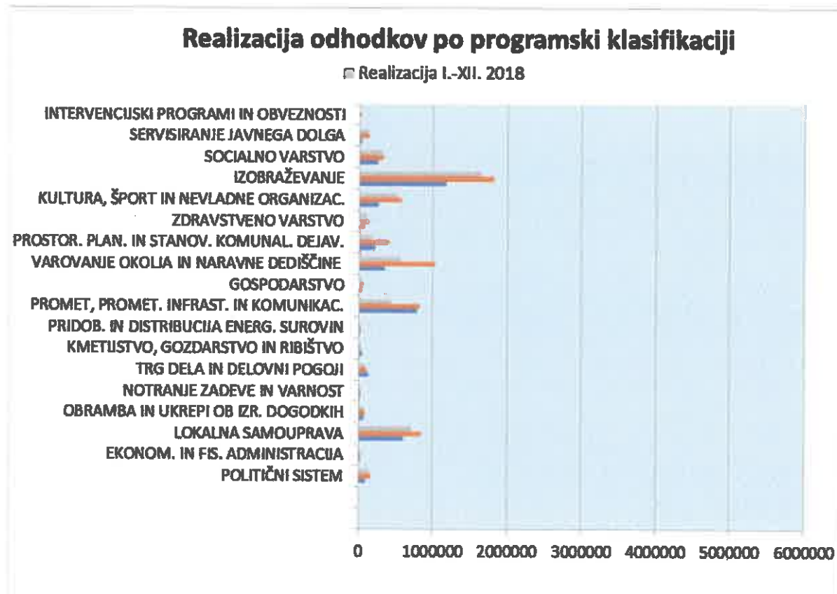
Graf 3: Prikaz realizacije odhodkov proračuna po programski klasifikaciji

Najpomembnejše zastavljene naloge na področju investicij so bile v letu 2018 naslednje: