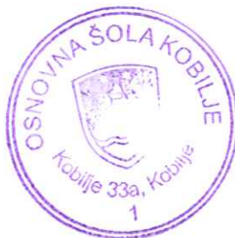
Ludvika Gjerek ravnateljica

Ustanoviteljico vrtca, Občino Kobilje, na podlagi prikazane tabele o sistemizaciji delovnih mest v vrtcu pri OŠ Kobilje za šolsko leto 2021/2022 na podlagi 108. člena Zakona o organizaciji in financiranju vzgoje in izobraževanja v RS (UI. RS 16/07 in spremembe), naprošamo za soglasje k sistemizaciji delovnih mest v vrtcu pri OŠ Kobilje za šolsko leto 2021/2022.