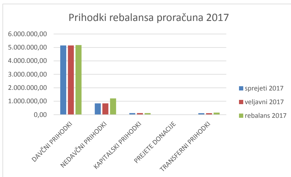
Slika 4: Grafični prikaz prihodkov rebalansa proračuna glede na sprejeti in veljavni proračun

Davčni prihodki (70) se zvišujejo za 0,55%. V okviru davčnih prihodkov se zvišuje dohodnina, davek na promet nepremičnin, znižuje pa se okoljska dajatev za onesnaževanje okolja zaradi odvajanja odpadnih voda. Pri sprejemanju proračuna smo upoštevali spremljanje realizacije preteklih let.