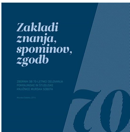
Slika 3: Naslovnica zbornika ob 70-letnici delovanja Pokrajinske in študijske knjižnice Murska Sobota

V letu 2016 je minilo 70 let od pričetka delovanja Pokrajinske in študijske knjižnice Murska Sobota. V ta namen, da bi predstavili naše delo, razvoj in dosežke smo izdali zbornik z naslovom Zakladi znanja, spominov, zgodb , ki je skupen projekt vseh zaposlenih v knjižnici. Zbornik predstavlja knjižnico skozi sedem desetletij delovanja, je pa poudarek na zadnjih 20-ih letih, ko je leta 1996 izšel zadnji zbornik o knjižnici. Izšel je na 115 straneh v 300 izvodih.