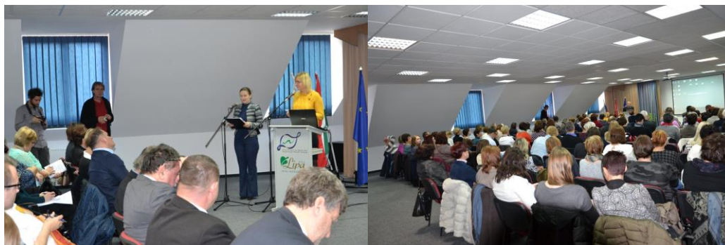
Slika 6: Mednarodna konferenca madžarsko-slovenskih knjižničarjev v Monoštru (14. 11. 2016)