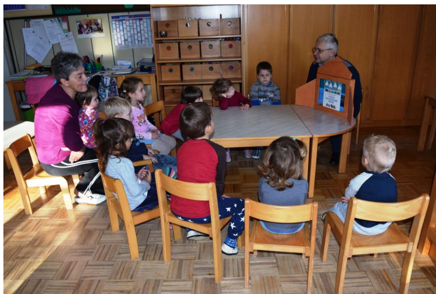
Slika 4: Pravljična ura z delavnico v vrtcu v Prosenjakovcih v novembru 2016

V okviru knjižnične vzgoje sta bili v dvojezičnih vrtcih v Prosenjakovcih in na Hodošu izvedeni pravljичni uri z delavnico z naslovom Najbogatejši vrabček na svetu .