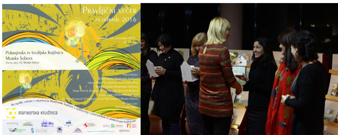
Slika 1: Vabilo in utrinek s pravljīčarkami za odrasle (29. 11. 2016)