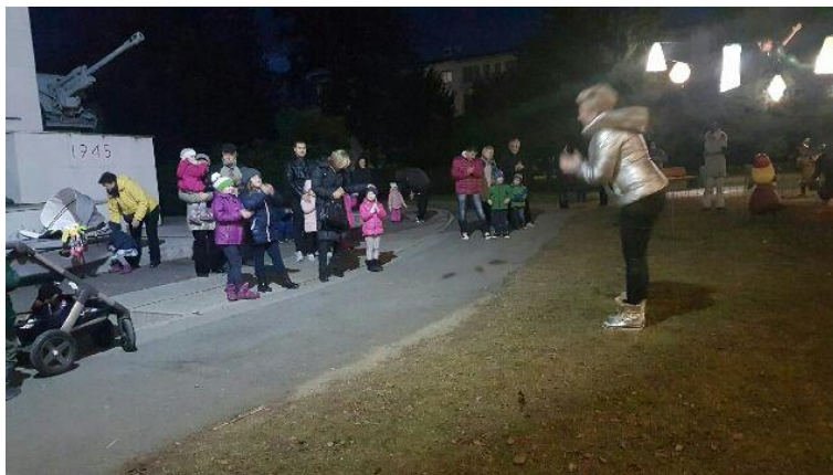
Slika 2: Pripovedovanje pravljice v soboškem parku v decembru 2016

Prav tako smo se v sodelovanju z Mestno občino Murska Sobota udeležili decembrskega praznovanja v parku, kjer so naše knjižničarke-pravljičarke otrokom učencem in staršem pripovedovale pravljice različnih junakov (Rdeča Kapica, Volk in sedem kozličkov, Trije prašički, itd.) ter različne praznične pravljice, ki so vsem popestrile torkov decembrski večer.