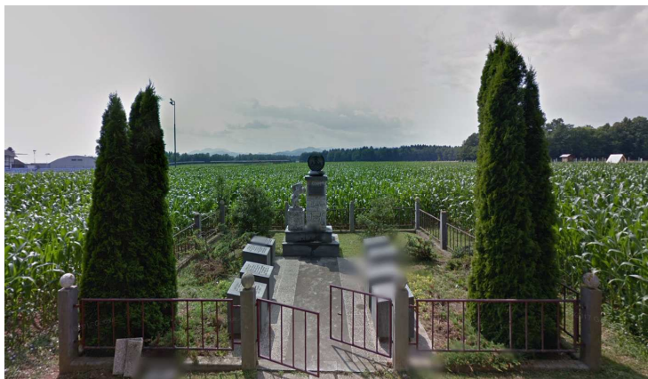
Slika 4: Spomenik talcem NOB

Območje OPPN se nahaja v vplivnem območju enote kulturne dediščine Šenčur – Vas, EŠD 14469, naselbinska dediščina. V samem območju urejanja se na severovzhodnem delu območja se nahaja enota memorialne dediščine Šenčur – Spomenik talcem NOB, EŠD 14141.