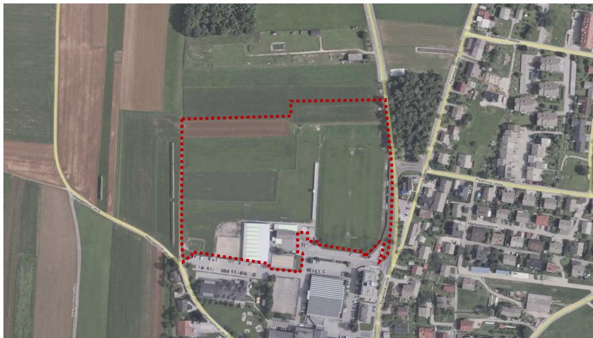
Slika 1: Prikaz območja OPPN na orto-fotu

Ostala zemljišča na območju OPPN so v naravi travniki in njive. Teren je razmeroma raven.