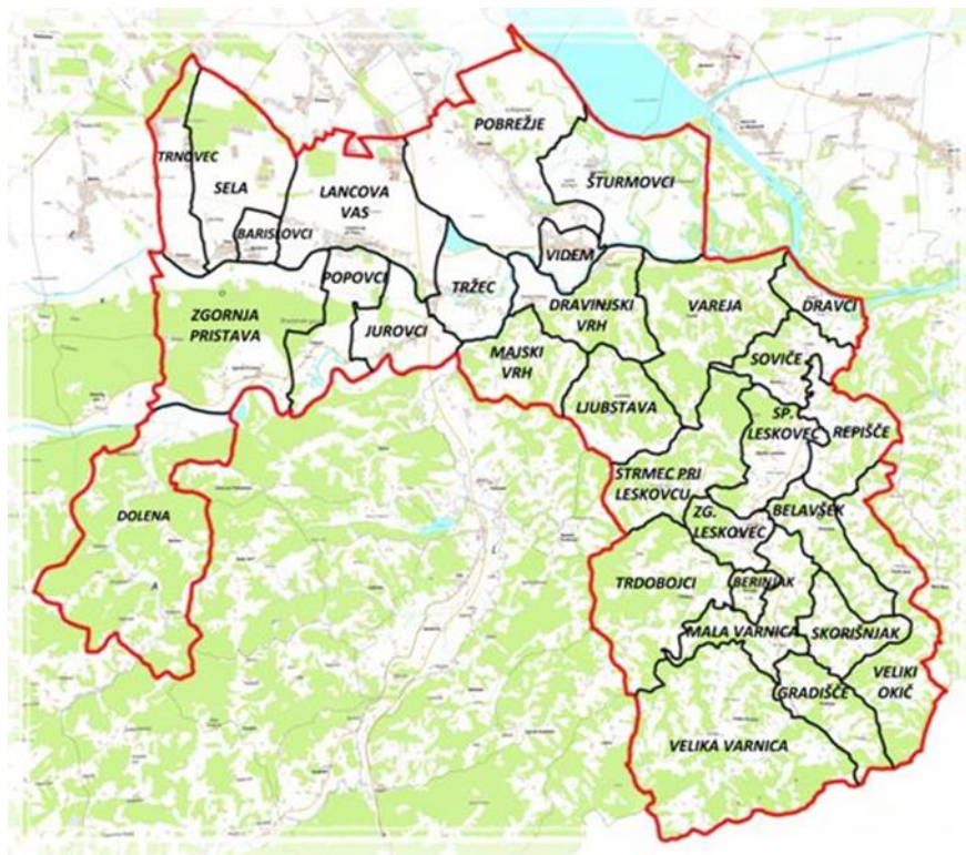
Slika 1: Zemljevid občine Videm