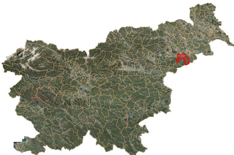
Slika 2: Lega občine Videm