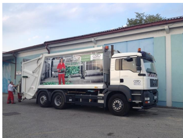
Fotografija 12 in 13: Smetarska vozila