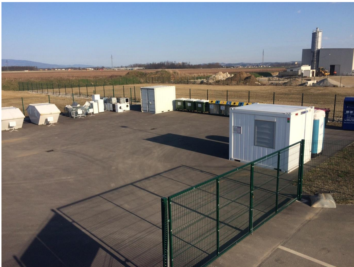
Fotografija 1: Zbirni center Videm

Datumi obratovanja zbirnega centra so navedeni na koledarju odvoza odpadkov.