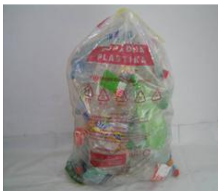
Fotografija 7: Vrečka za mešano embalažo

Za zbiranje steklene embalaže, ki poteka preko zbiralnic ločenih frakcij uporabljamo plastične zabojnike, volumnov 240 l in 1100 l in sicer: