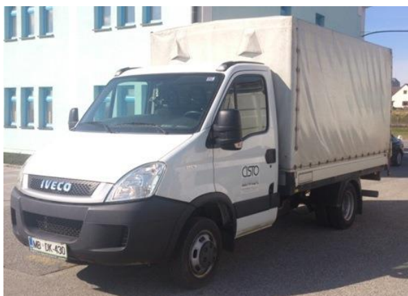
Fotografija 18 in 19: Vozila za prevoz in zbiranje nevarnih odpadkov

Za zbiranje in prevoz nevarnih frakcij uporabljamo specialna vozila, s pokritim kesonom in dovoljenjem za prevoz nevarnih snovi.