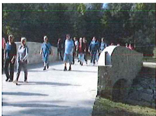
Pohod ob dnevu Zemlje