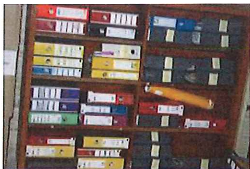
Arhiv ZTKŠ Beltinci