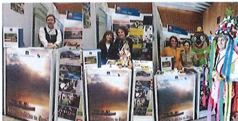
Sejem Alpe-Adria 2020, Ljubljana, 29.1. - 1.2.2020