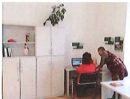
Info točka e-documenta Pannonica, grad Beltinci