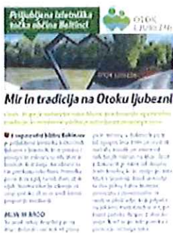
Objava v prilogi Slovenskih novic, Svet 24, avgust 2020

Skozi vse leto 2020 smo redno poročali medijem o aktivnostih, ki smo jih načrtovali in izvajali. Pripravljali smo številne članke in objave z namenom promocije občine Beltinci. Objave o napovedih in izvedbi dogodkov, reportaže s področja delovanja ZTKŠ Beltinci v televizijskih, radijskih, tiskanih in elektronskih medijih: Vestnik, Večer, Delo, Dnevnik, Radio Murski val, Radio Maxi, MGM Media Optima Ljubljana (Obrazi, Eva, Smrklja, Lepa & zdrava), Ognjišče, pomurje.si, pomurec.com, sobotainfo.com, prlekija.on.net, visitpomurje.si, Kmečki glas, Radio Slovenija, POP TV, RTV SLO, Slovenske novice, Svet 24, drugi mediji.