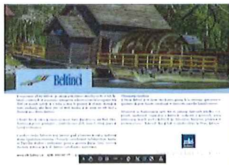
Objava v reviji Eko dežela, april, 2020