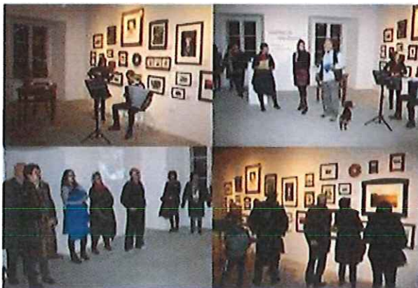
Fotografska razstava »Po stopinjah mojega deda«, grad Beltinci, 31.1.2020