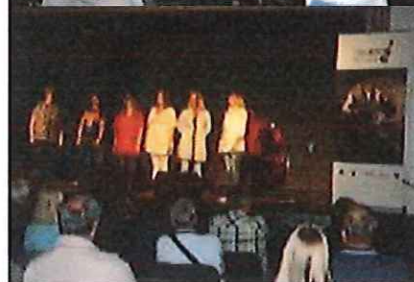
Koncert Marko bande z gosti, Kulturni dom Beltinci, 17.7.2020