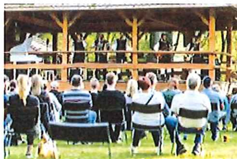
Koncert ansambla Modrijani, Otok ljubezni, 20.9.2020