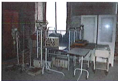
Deponirana zdravstvena oprema