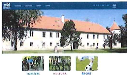
Nova spletna stran www.ztks-beltinci.si

Prav tako smo na facebooku skozi vse leto objavljali novice, obvestila, predstavljali aktualne dogodke ter o njih poročali.