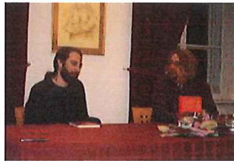
Literarni večer »Rdeče Prekmurje«, grad Beltinci, 17.1.2020