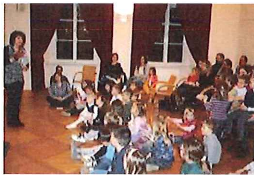
Pravljичni večer, grad Beltinci, 20.2.2020