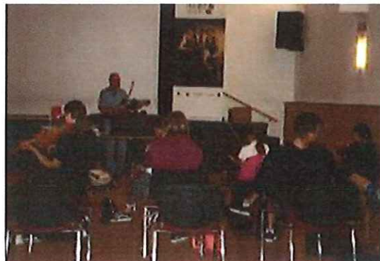
Dvodnevni glasbeni tabor Ljudska glasbena dediščina, Beltinci, 16. in 17.7.2020