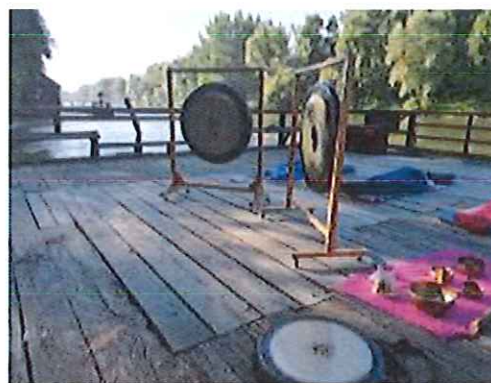
Meditacija z gongi