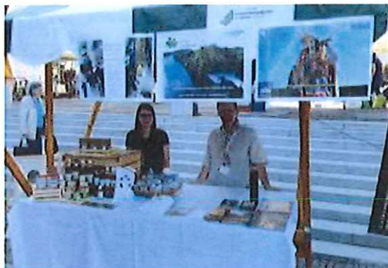
(Do)živimo v Pomurju, Pogačarjev trg Ljubljana, 4.7.2020