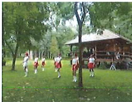
Koncert Prekmurske godbe Bakovci z mažoretkami, Otok ljubezni, 30.8.2020