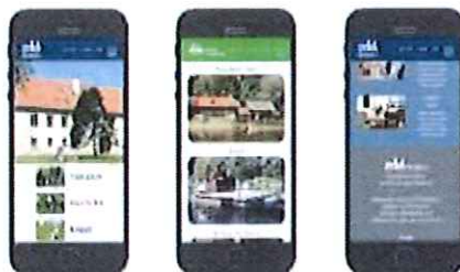
Spletna stran www.ztks-beltinci.si prilagojena uporabnikom pametnih telefonov