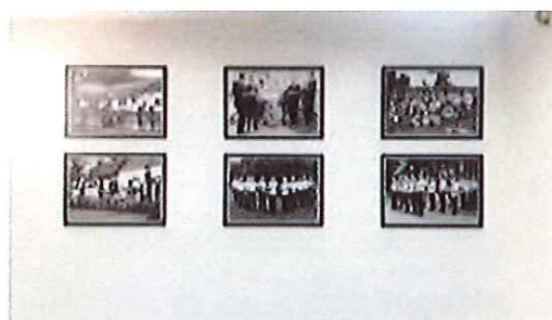
Razstava fotografij nekdanjih in sedanjih godčevskih zasedb z razlagalno tablo, avla Kulturnega doma Beltinci

Leta 2020 je zaradi epidemiološke situacije v Sloveniji in v svetu skoraj v celoti zamrlo delovanje na področju kulture, tako so odpadle vse načrtovane aktivnosti v mesecu marcu, aprilu, maju oktobru, novembru in decembru.