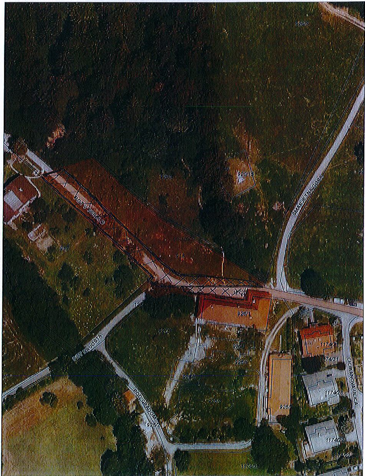
Parc. št. 918 in 1272/1, k.o. 2131 - Stražišče