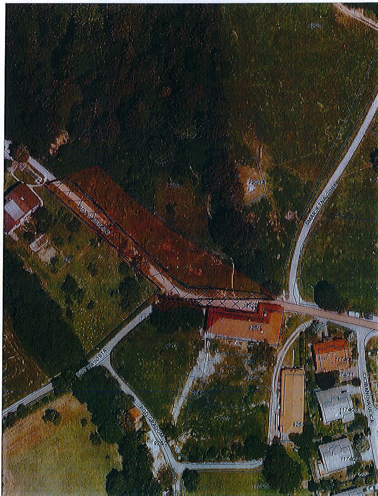
Parc. št. 918 in 1272/1, k.o. 2131 - Stražišče