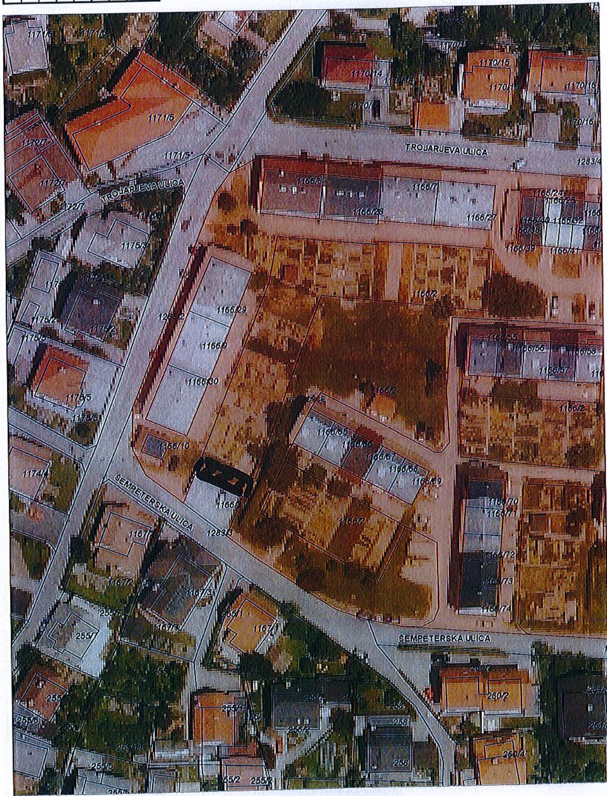
Parc. št. 1166/2, k.o. 2131 - Stražišče